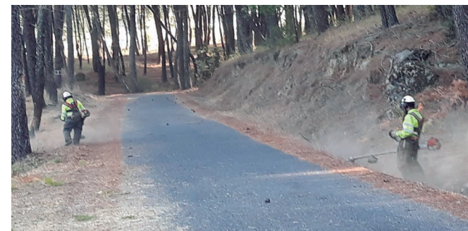
Trabajos con motodesbrozadora