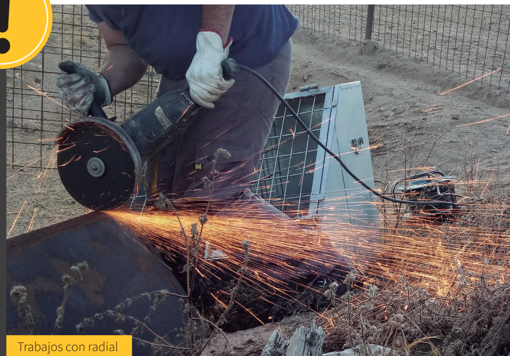
Trabajos con radial

“ Es responsabilidad del operario en campo no iniciar o suspender la actividad cuando lo marque el índice de riesgo o por condiciones locales prevea riesgo de incendio y/o comprometa su seguridad y la de terceros. ”