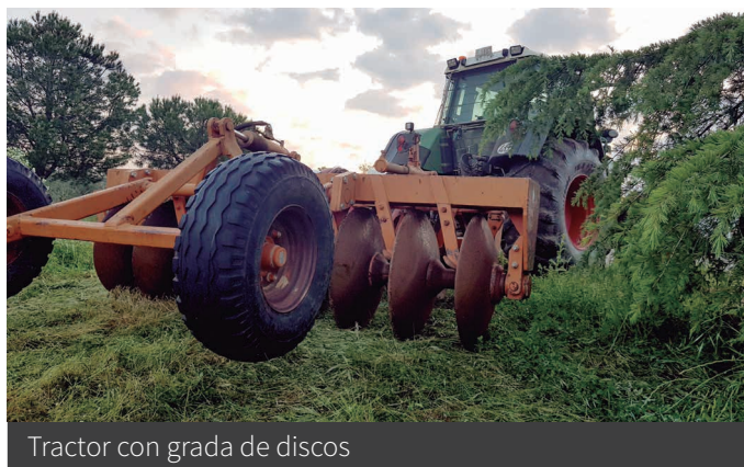
Tractor con grada de discos