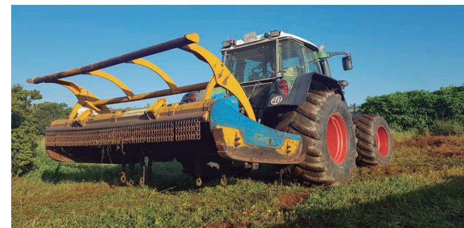
Tractor con desbrozadora de cadenas