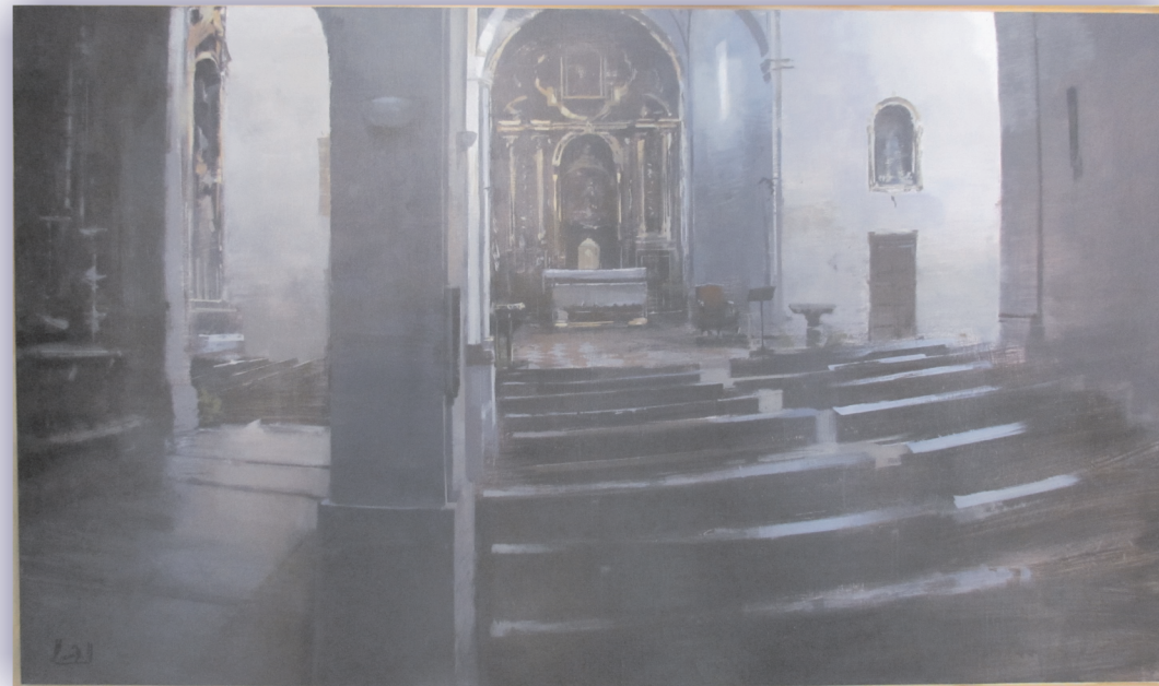
1 Premio Certamen Pintura 2015