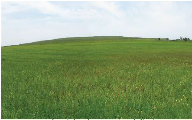
Volcán de la Cabeza (Fernán Caballero)