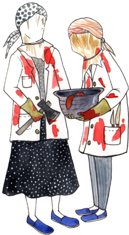
Mondongueras y mondongueros