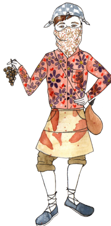
Bodegueras y bodegueros