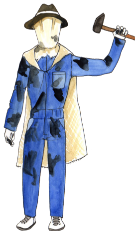
Herreras y herreros