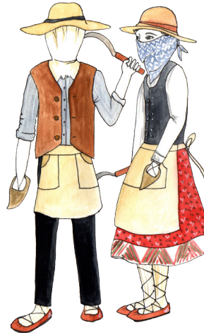
Trilladoras y trilladores