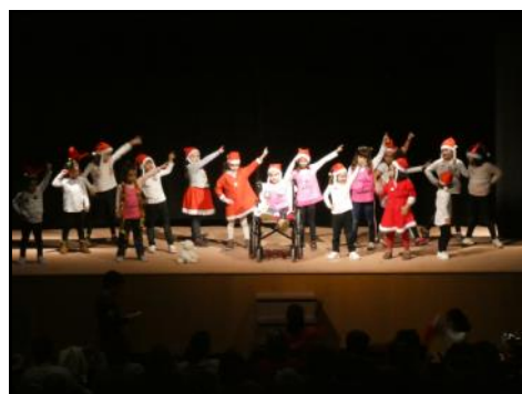
El grupo de Baile Activo® de la Escuela Municipal de Música y Danza no para ni con una pierna rota