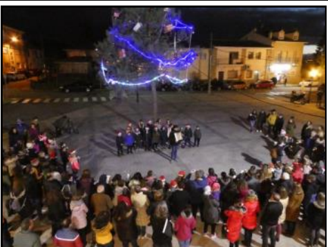
La Escuela Municipal de Música y Danza (la Palestra) ofreció un recital de villancicos a los pies del árbol de Navidad