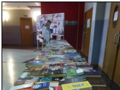
La biblioteca de San Cristóbal de Segovia organizó un mercadillo navideño solidario de libros