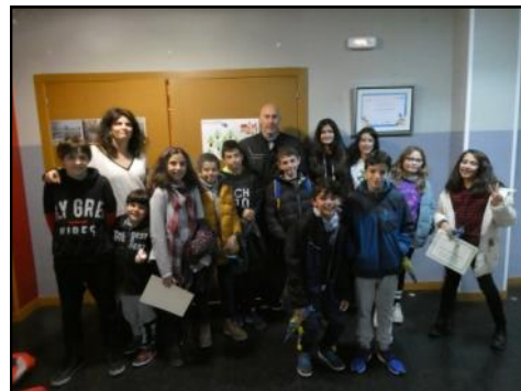
Se celebró el último Consejo de Infancia del año y los niños se encargaron de sustituir el anterior título “CAI” por el nuevo 2018-22