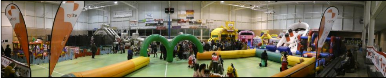
El Ayuntamiento trajo por segundo año consecutivo Naviland a San Cristóbal de Segovia