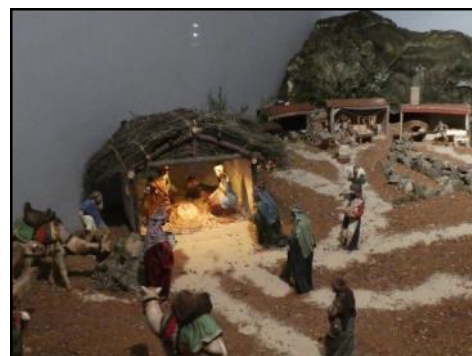
La asociación “Amigos de San Cristóbal” se encargó un año más de elaborar con todo su arte y esmero el belén municipal