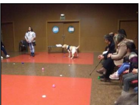
Se realizaron en Navidad numerosos talleres de juegos tradicionales, stretching en familia, taller de las emociones y terapia con perros