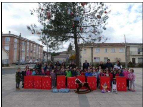
Los vecinos y niños y niñas del colegio aportaron su granito de arena a la recogida y donación de juguetes que se hizo a Cáritas