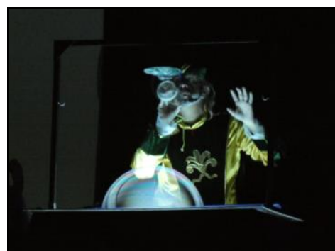
La compañía Pomper trajo un espectáculo de burbujas gigantes para los más pequeños