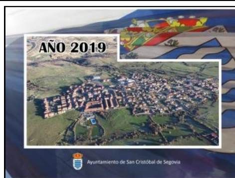
El Ayuntamiento de San Cristóbal de Segovia editó un calendario que buzoneó a los domicilios del municipio