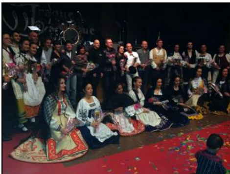
Atraque Barraque junto a dos formaciones invitadas ejecutaron el Folksticio de Invierno con gran éxito. Qué bien suenan.