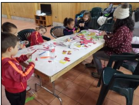
El Ayuntamiento abrió las puertas de la actividad “Enróllate” para entretener a los más pequeños en los talleres navideños