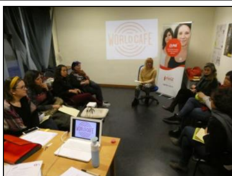
Organizado por Segovia Sur, la Fundación Mujeres, Alma Natura, Colca Cola y colaborando el Ayuntamiento, llegó “Gira Mujeres”