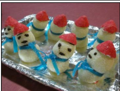
La originalidad y el buen gusto fueron los ingredientes principales de los chefs que se presentaron al concurso de postres