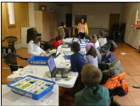
Impartido por “Robots School”, se realizó un taller de robótica para los más pequeños