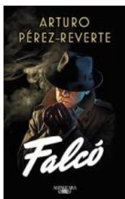
Falcó Arturo Pérez-Reverte