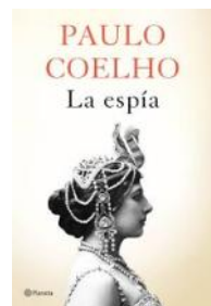
La espía Paulo Coelho