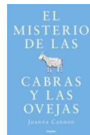
El misterio de las cabras y las ovejas Joanna Cannon