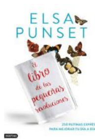
El libro de las pequeñas revoluciones Elsa Punset