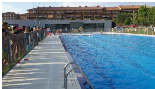
Carrera de natación