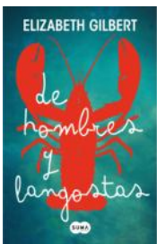
De hombres y langostas (E. Gilbert)