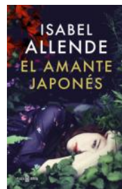
El amante japonés (I. Allende)