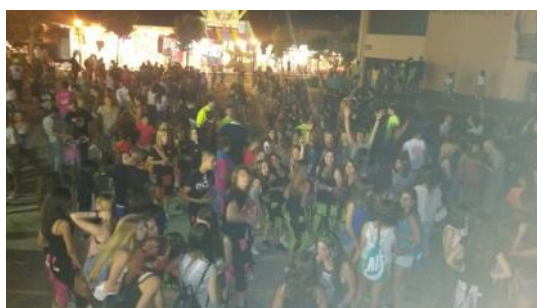
Verbena del viernes