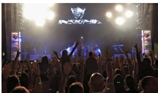
Grupo musical del sábado