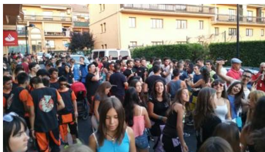
Desfile de peñas