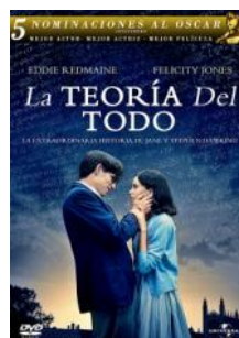
La teoría del todo