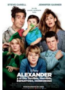
Alexander y el día terrible, horrible, ...