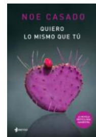
Quiero lo mismo que tú (N. Casado)