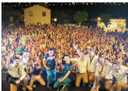
Concierto del sábado