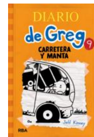
Diario de Greg, 9: carretera y manta (J. Kinney)