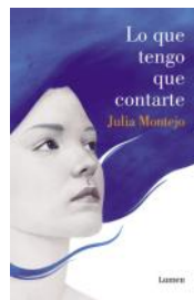
Lo que tengo que contarte (J. Montejo)