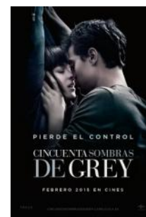
Cincuenta sombras de Grey