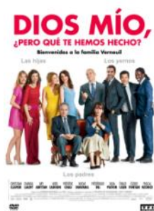
Dios mío, ¿pero qué te hemos hecho?