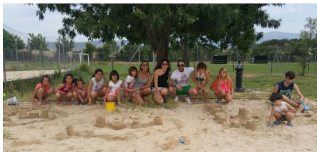
Castillos de arena