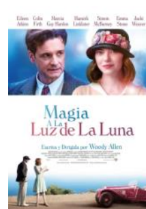
Magia a la luz de la luna