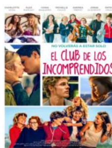
El club de los Incomprendidos