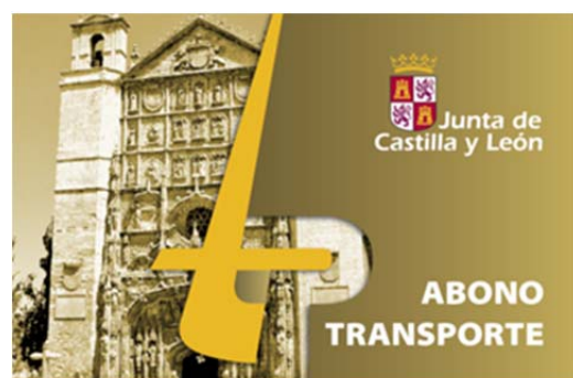
ABONO TRANSPORTE ESPECIAL