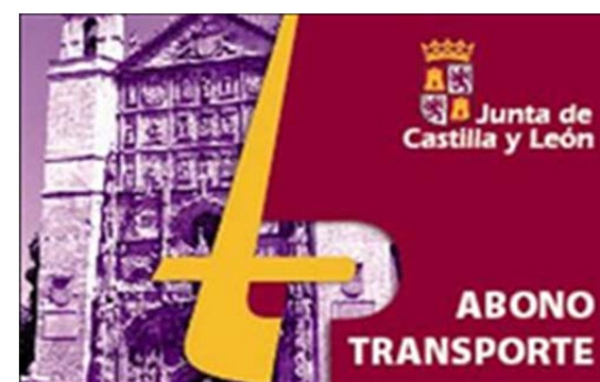
ABONO TRANSPORTE ORDINARIO

A PARTIR DEL 20 DE MARZO DE 2017 COMENZARÁ UNA NUEVA FASE DEL TRANSPORTE METROPOLITANO PARA LOS USUARIOS DE LA LÍNEA DE ZARATÁN .