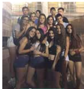
PEÑA LA FUGA