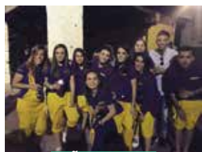
PEÑA EL KAOS