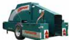
Frostbuster Protección máxima 8 hectáreas