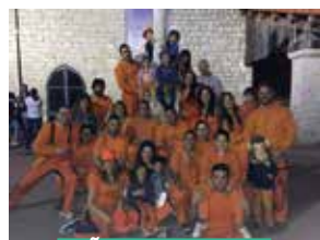
PEÑA LOS BRUJOS