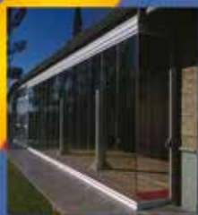
CORTINAS DE VIDRIO