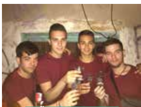
PEÑA EL RECORTE