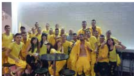
PEÑA LA RESACA