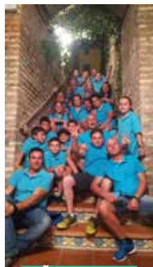
PEÑA TIKI TAKA