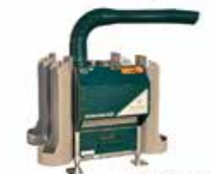
FrostGuard Protección máxima 1 hectárea