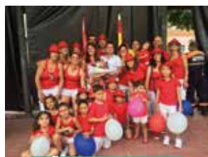
PEÑA CEDA EL VASO