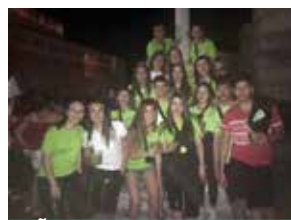
PEÑA TIRITRIS Y EL PUNTAZO