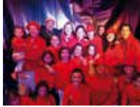
Ceda El Vaso