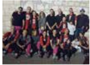
Los Tryptis K Faltaban