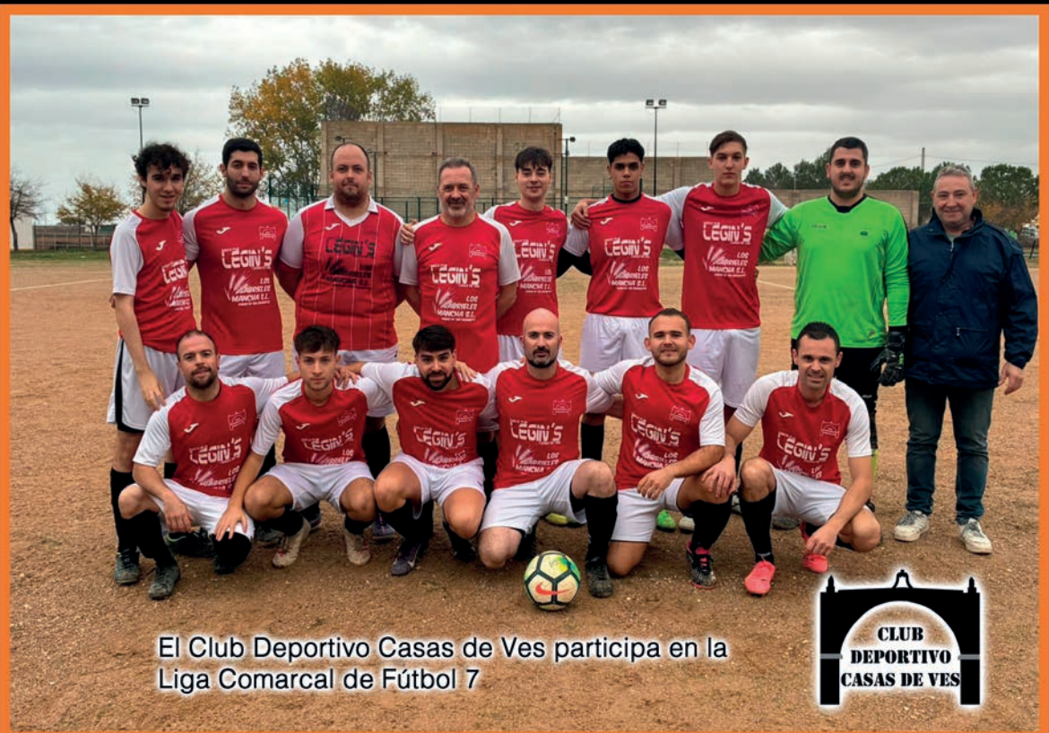
El Club Deportivo Casas de Ves participa en la Liga Comarcal de Fútbol 7