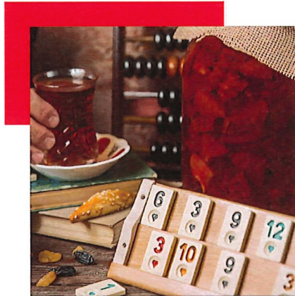
Tarde de juegos el 13 de diciembre