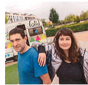
Tremendo Facto. Un taller de batalla de gallos contra la IA

En un tiempo en que el mundo parece moverse entre la ansiedad y la esperanza, la música nos ofrece un refugio: un espacio donde las voces pueden encontrarse y sanar. Este encuentro no es solo una actuación coral, es una experiencia y una oportunidad que, desde distintos lenguajes, comparten un mismo anhelo: la paz.