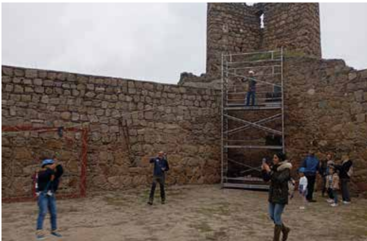
Tirolina a cargo del GOM