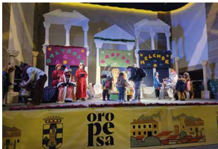
Los Reyes Magos visitan Oropesa