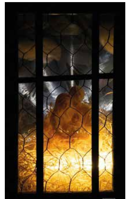
Concurso alumbrado vecinal