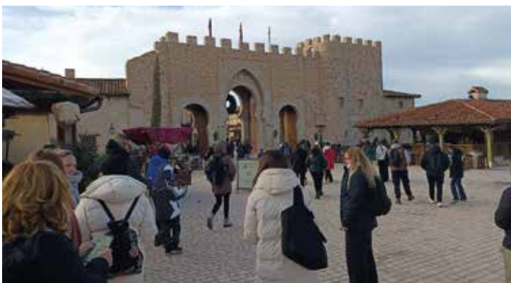
Viaje a Puy du Foi