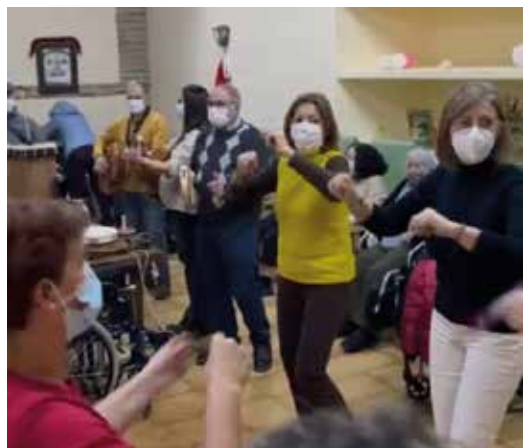
Visita a la residencia de mayores