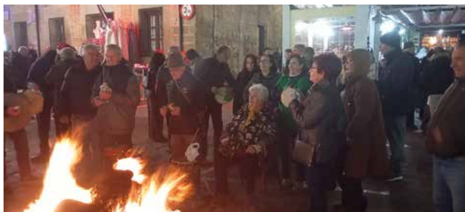
Villancicos en el Navarro