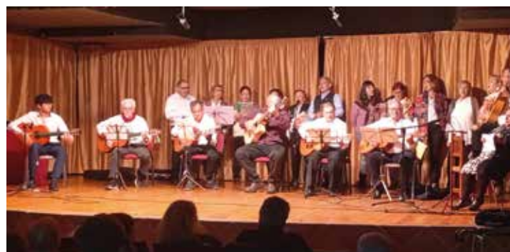
Concierto rondalla Centro de Mayores