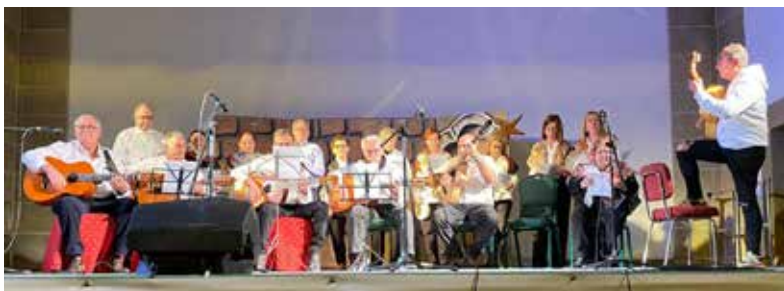
Certamen de Villancicos