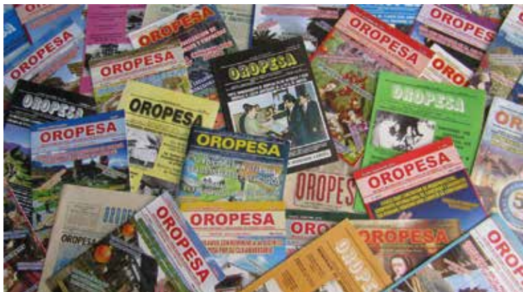
Collage de todas las ediciones en resumen de la Revista Oropesa

A lo largo de su historia, la revista ha entrevistado a personalidades nacionales e internacionales y ha documentado visitas y eventos relevantes. Asimismo, ha contado con la colaboración de numerosos articulistas e intelectuales, algunos de los cuales ya fallecieron y son recordados como pilares del proyecto. La Revista Oropesa en sus 133 ediciones contiene diversos artículos referentes a la historia del distrito de Oropesa .