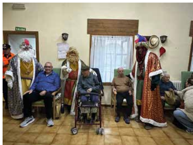
Los Reyes Magos en la residencia de mayores