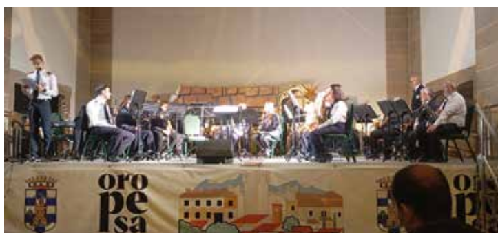
Concierto de la Banda de Música