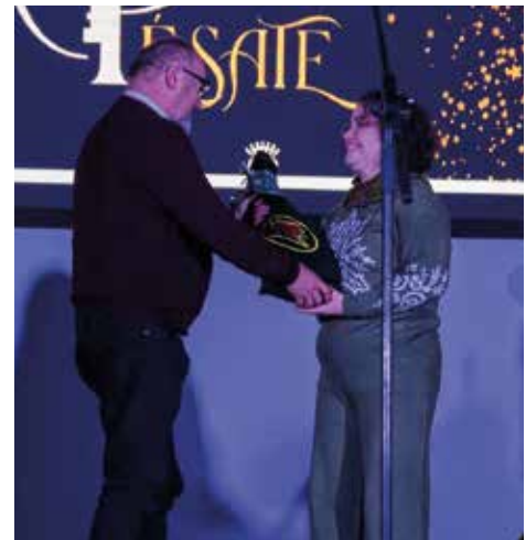
Ganadora Certamen de postres