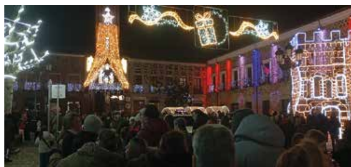
Reparto de migas con chocolate