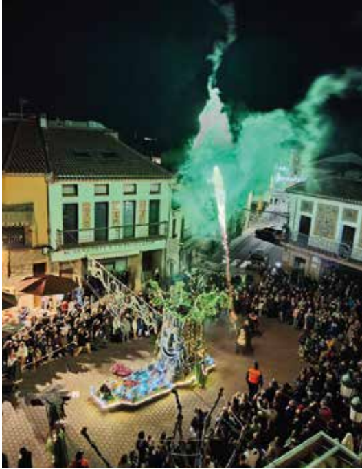
Encendido de Navidad