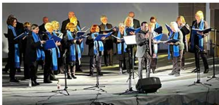
Coral "Voces de Gredos"