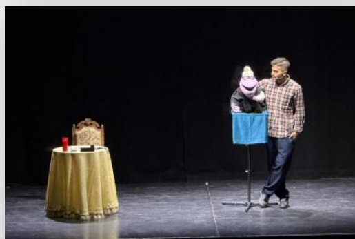
Celebramos el Día de la Infancia con un espectáculo de ventriloquía