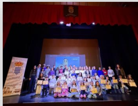
Entrega de becas deportivas y de estudios.