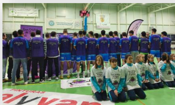
Acto por la igualdad y contra la violencia hacia las mujeres