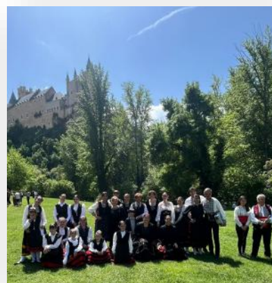
ACTUACIÓN DEL GRUPO MUNICIPAL DE JOTAS EN EL BARRIO DE SAN MARCOS