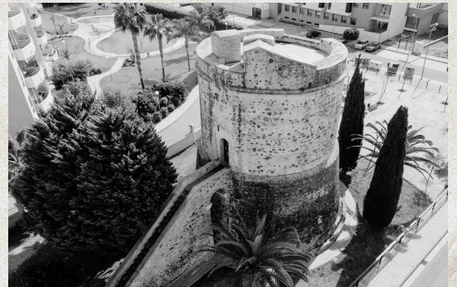
MÚSICA, TEATRO Y EVENTOS

LA CULTURA BRILLARÁ EN ALGARROBO CON UNA PROGRAMACIÓN PARA TODOS.