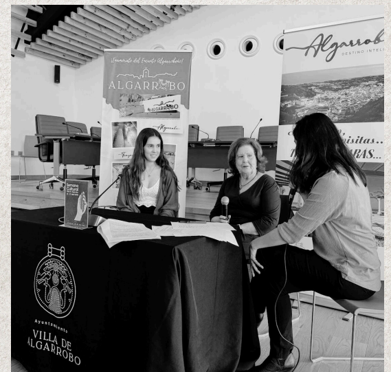
CONFERENCIAS Y PODCAST