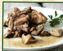
Bar- Restaurante "Villa de Sepúlveda"