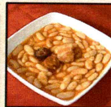
Bar- Restaurante "La Cocina"