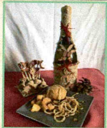
Bar- Restaurante "Paulino"

Pimiento relleno de setas y bacalao con salsa de boletus.