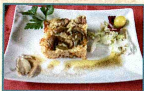
Bar- Restaurante "Cristóbal"