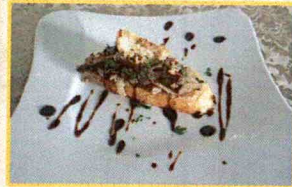
Restaurante "Puerta Sepúlveda"

Tallarines al aroma del laurel con una suave crema de boletus y setas de temporada, con crujiente de cebolla.