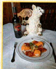
Bar- Restaurante "Señorío de Sepúlveda"

Pimientos rellenos de carne y boletus con su respectiva salsa.