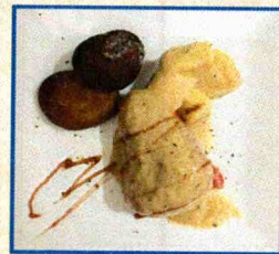
Bar La Queda

Tosta de setas y boletus con piñones y chips de parmesano.