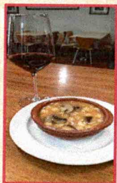
Cafetería "Vado del Duratón"