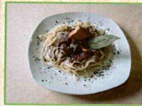
Bar- Restaurante "Samoa"

Tallarines al aroma del laurel con una suave crema de boletus y setas de temporada, con crujiente de cebolla.