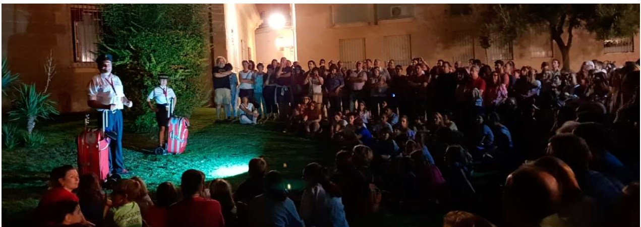
Aerolíneas de Leyenda #OnsosyLainas en Huesca