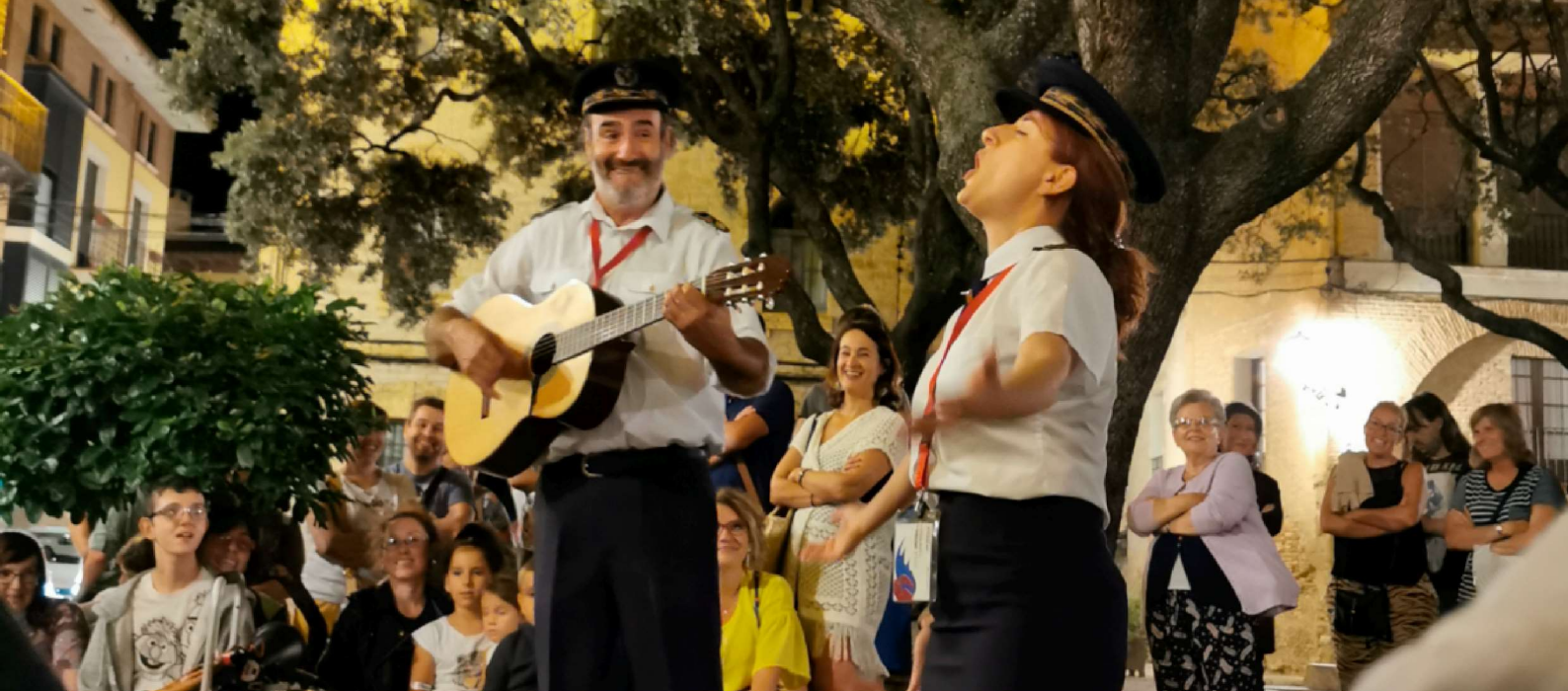
Aerolíneas de Leyenda #RutaDelDiaple en Huesca