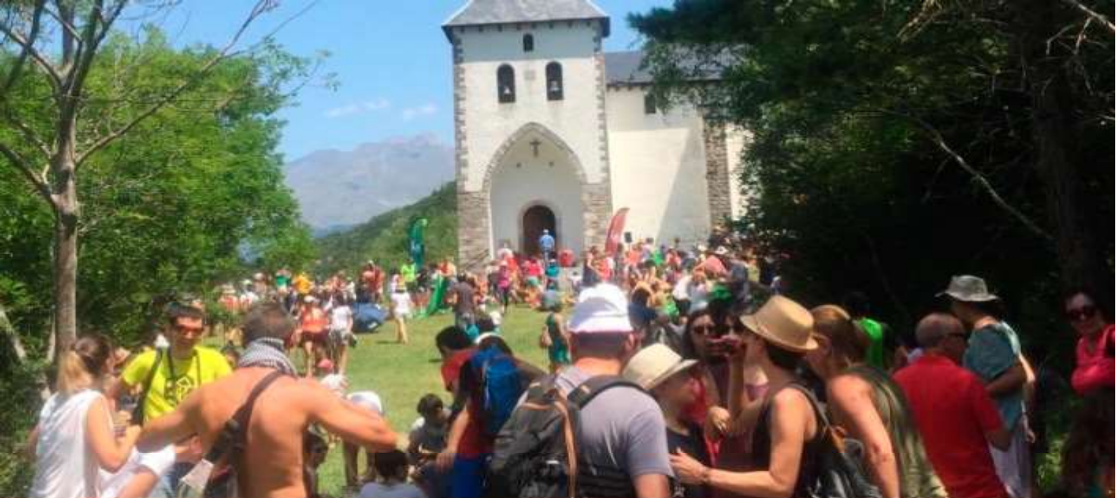
Aerolíneas de Leyenda #Aragón en el Festival Pirineos Sur