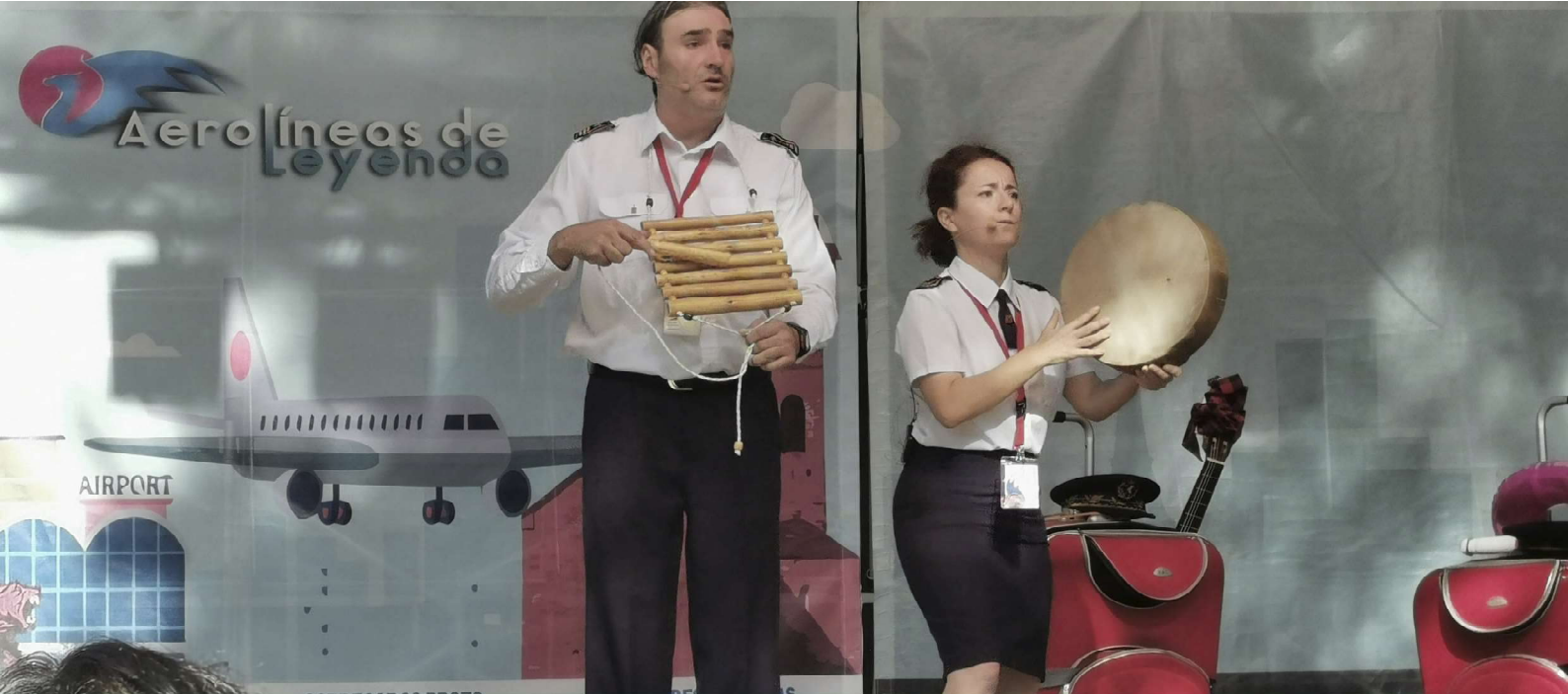
Aerolíneas de Leyenda #AragónEspacioLegendario en el Parque de las Marionetas de Zaragoza