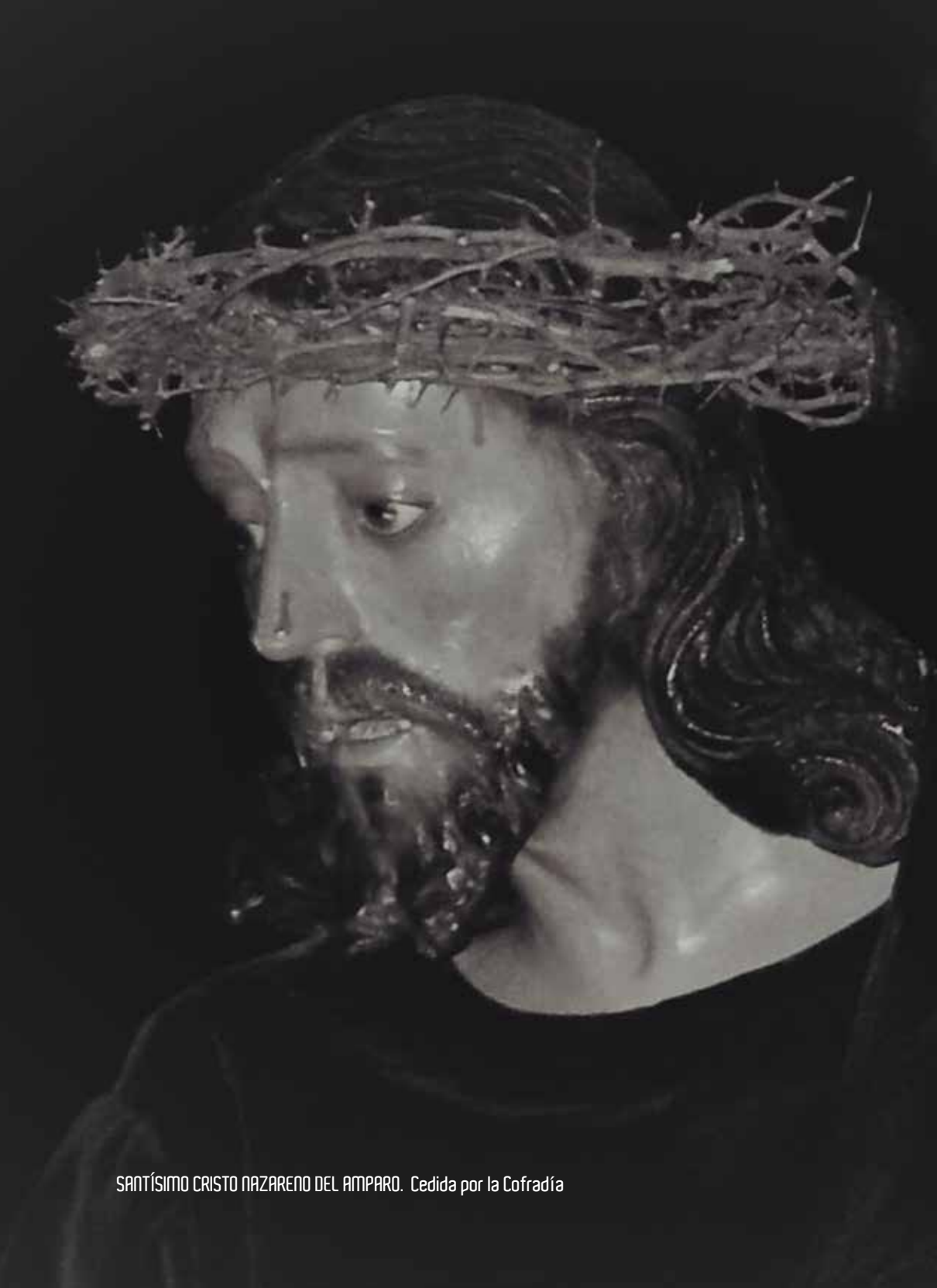
SANTÍSIMO CRISTO NAZARENO DEL AMPARO. Cedida por la Cofradía