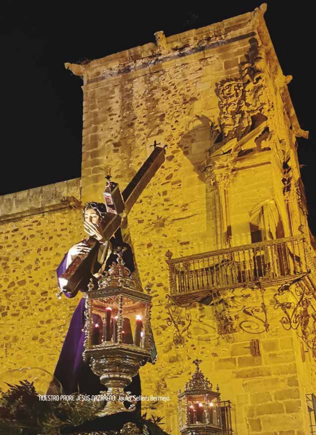
NUESTRO PADRE JESÚS NAZARENO. Javier Sellers Bermejo