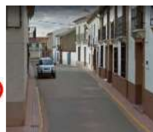
C/J. DE BORBÓN-PLAZA 5º CENTENARIO