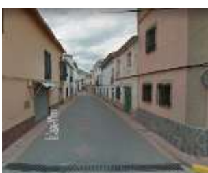
AVDA. DE LOS MÁRTIRES

En nuestra población la velocidad máxima genérica quedará establecida en 30 km/h en todas las calles y travesías , excepto en las calles del centro de población que se encuentran adoquinadas (consideradas plataforma única acera y calzada), quedando establecida en 20km/h para estas calles