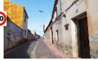
C/ S. JOSÉ