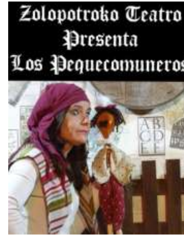
31 de Julio - 20:00 h. en la Plaza de Toros Teatro "Zolopotroko" con los "Los Peque- Comuneros"