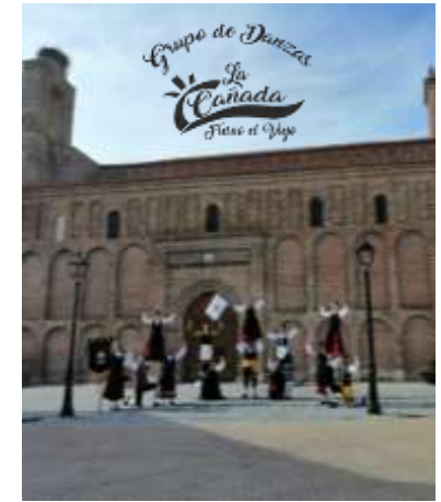
7 de Agosto 20:30 h. en la Plaza de Toros Actuación Grupo de Danzas "La Cañada"