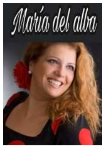
20 de Agosto 20:30 h. en el Patio de la Casa de Cultura Actuación de "María del Alba"