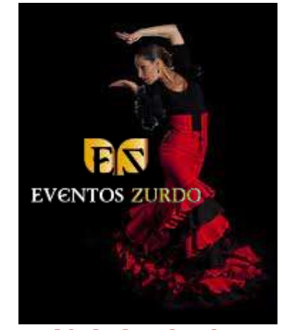
18 de Septiembre 12:00 h. en la Plaza de Toros Festival Flamenco Por "Eventos Zurdo"