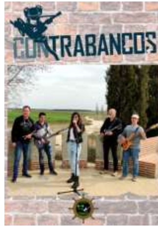
30 de Julio 22:30 h. en el Patio de la Casa de Cultura Concierto "Con Trabancos"