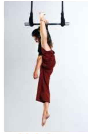
21 de Agosto 20:30 h. en la Plaza de España The Freak Cabaret Circus presenta "Cabaret Circo"