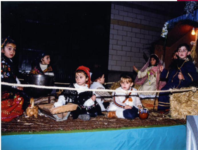
Fotos del fondo del Ayuntamiento Cabalgata y Entrega de regalos año 2003