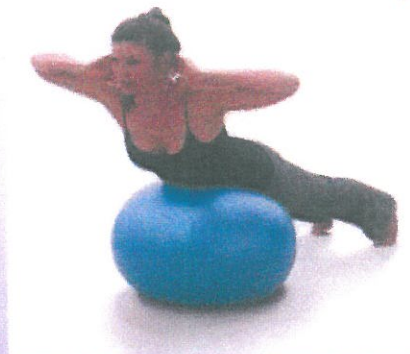
PELOTAS DIFERENTES TAMAÑOS