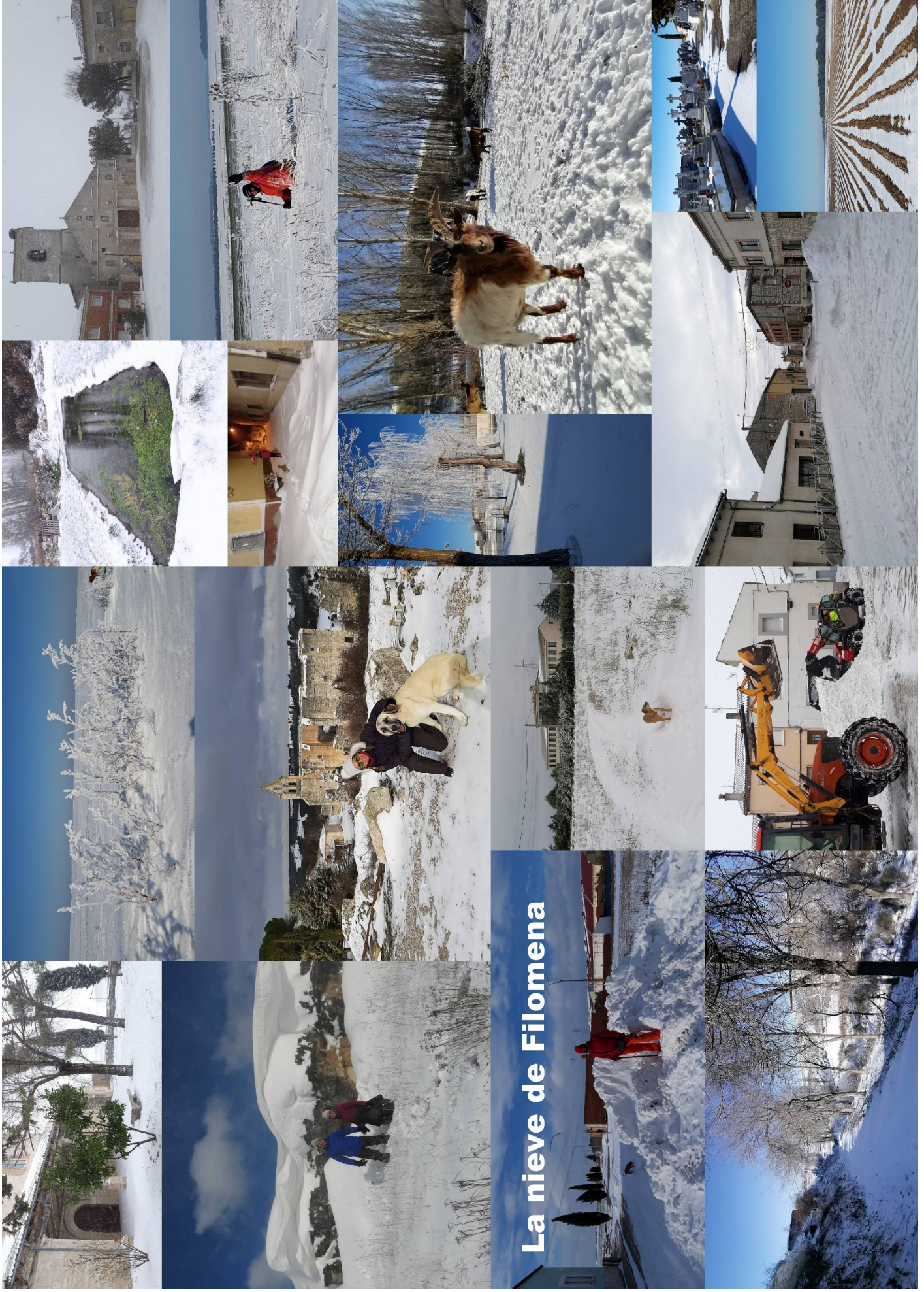
La nieve de Filomena