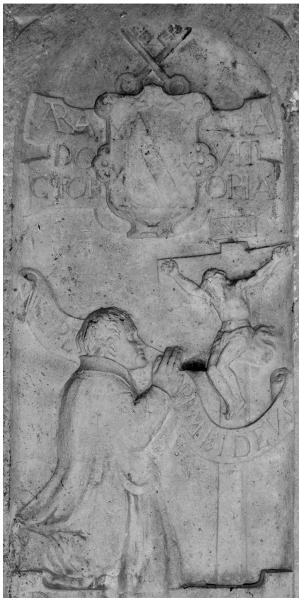
Relieve realizado en 1567 que representa al Doctor Vitoria, procedente de la antigua casa parroquial.

Estos habitantes, según la respuesta a la pregunta 22, vivían en 171 casas. Todas bajas y habitables, excepto 15 que eran altas, y siete que estaban arruinadas. En la pregunta 24 se señalan establecimientos pertenecientes al común: una taberna donde se vendía vino, que producía 1.000 reales; una abacería para vender aceite, vinagre, legumbres secas, bacalao... que rentaba 600 reales anuales y 200 la carnicería.