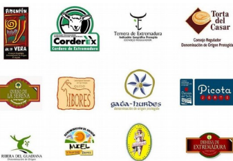
Denominaciones de Origen Extremadura

¿QUE VOY A HACER Y A APRENDER? Para pequeños negocios Puesta en marcha y gestión de un pequeño negocio alimentario físico y on line Para Grandes y Pequeños negocios Estrategias de marketing para potenciar ventas y fidelizar clientes Exposición y publicidad de alimentos puntos de venta y ferias Logística de alimentación Manipulación, conservación y obtención de porciones de productos frescos Marketing digital para productos alimentarios on line y Gestión informática de la documentación