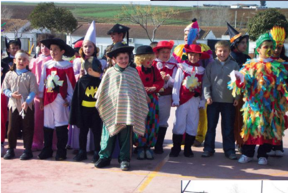
Carnavales año 2005