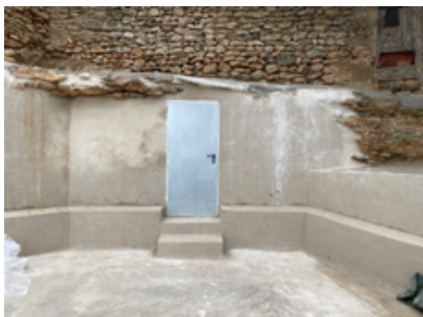
Mirador de la Cueva