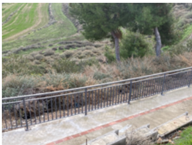
Vallado de la senda