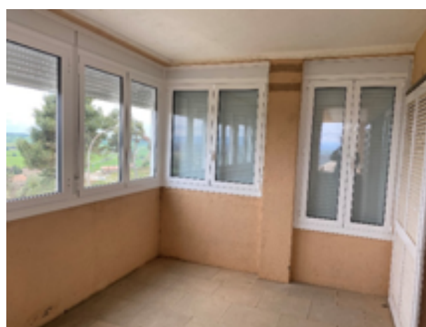
Cerramiento de la 3ª Edad