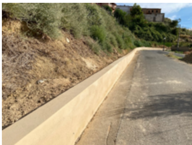
Muro de las piscinas