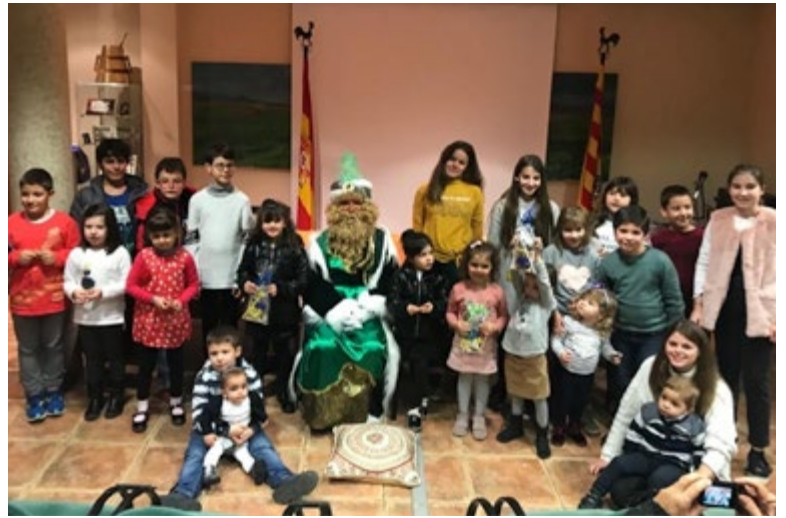
Imagen de archivo (2018)

Como cada año, el paje de SS.MM los Reyes Magos de Oriente vendrá a nuestro municipio. Concretamente, a la Casa Consistorial. En su Salón de Actos, el paje real recogerá las cartas de los mas pequeños -y no tan pequeños-, para poder conocer todos sus deseos, peticiones y juguetes. Esperemos que los pequeños -y no tan pequeños- os hayáis portado bien y se hagan realidad vuestros deseos.