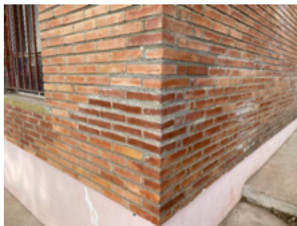
Reparación de las grietas de Casa Cuartel