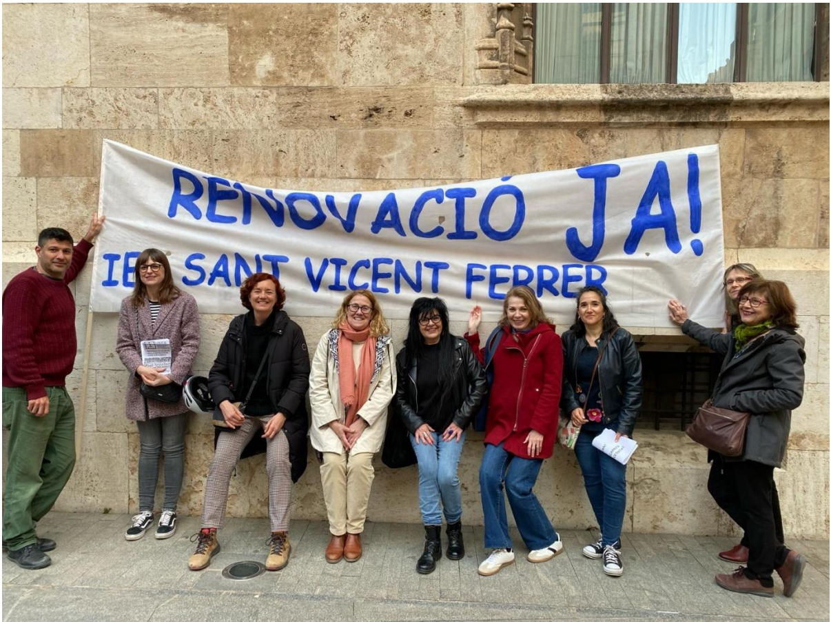
El profesorado del IES San Vicente Ferrer impulsando la renovació.