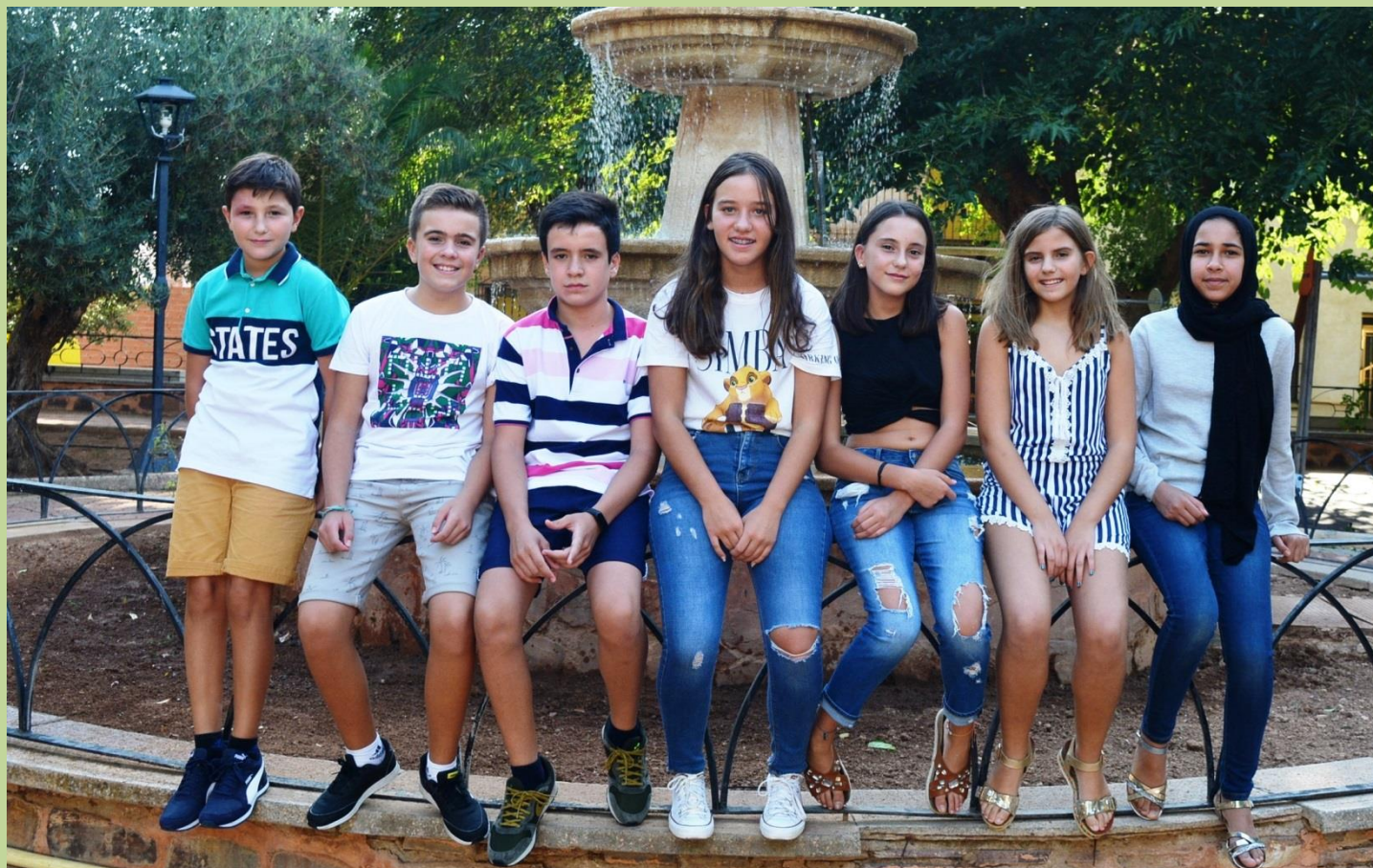
Feria y Fiestas en honor de Ntra. Sra. del Rosario 2019

Revista de Información Local de Valenzuela Cva Nº 52