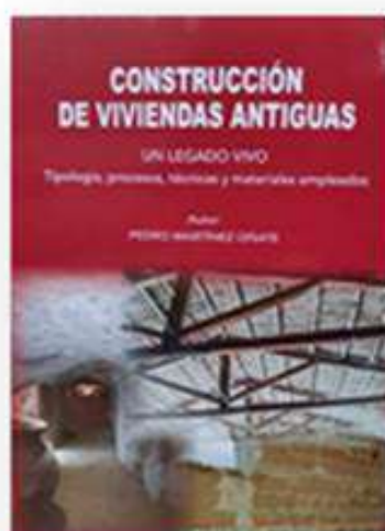
Construcción de viviendas antiguas PEDRO MARTÍNEZ OÑATE