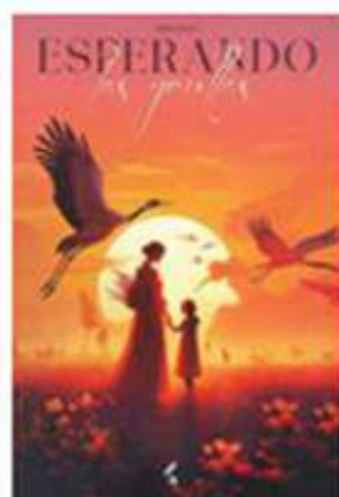
Esperando las grullas GINA LUCA