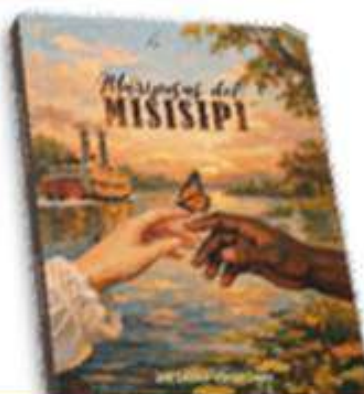
Mariposas del Misisipi JOSÉ A. CEBRIÁN LÓPEZ