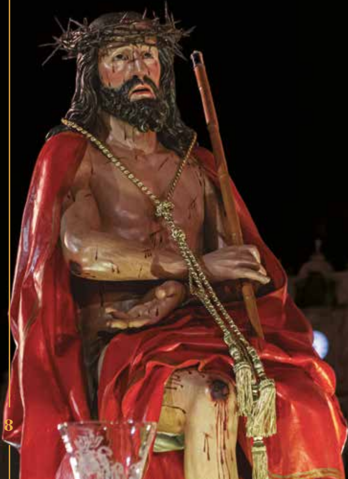
Ecce Homo. Francisco Alonso de los Ríos. Segundo cuarto del siglo XVII Cofradía: Ecce Homo.

Recorrido: Plaza Leciniana, Bautista, Rodríguez Chico, Empedrada, Plza. Nueva, "Coronación" Manuel Salvador Carmona, Plza. Leciniana y Bautista.