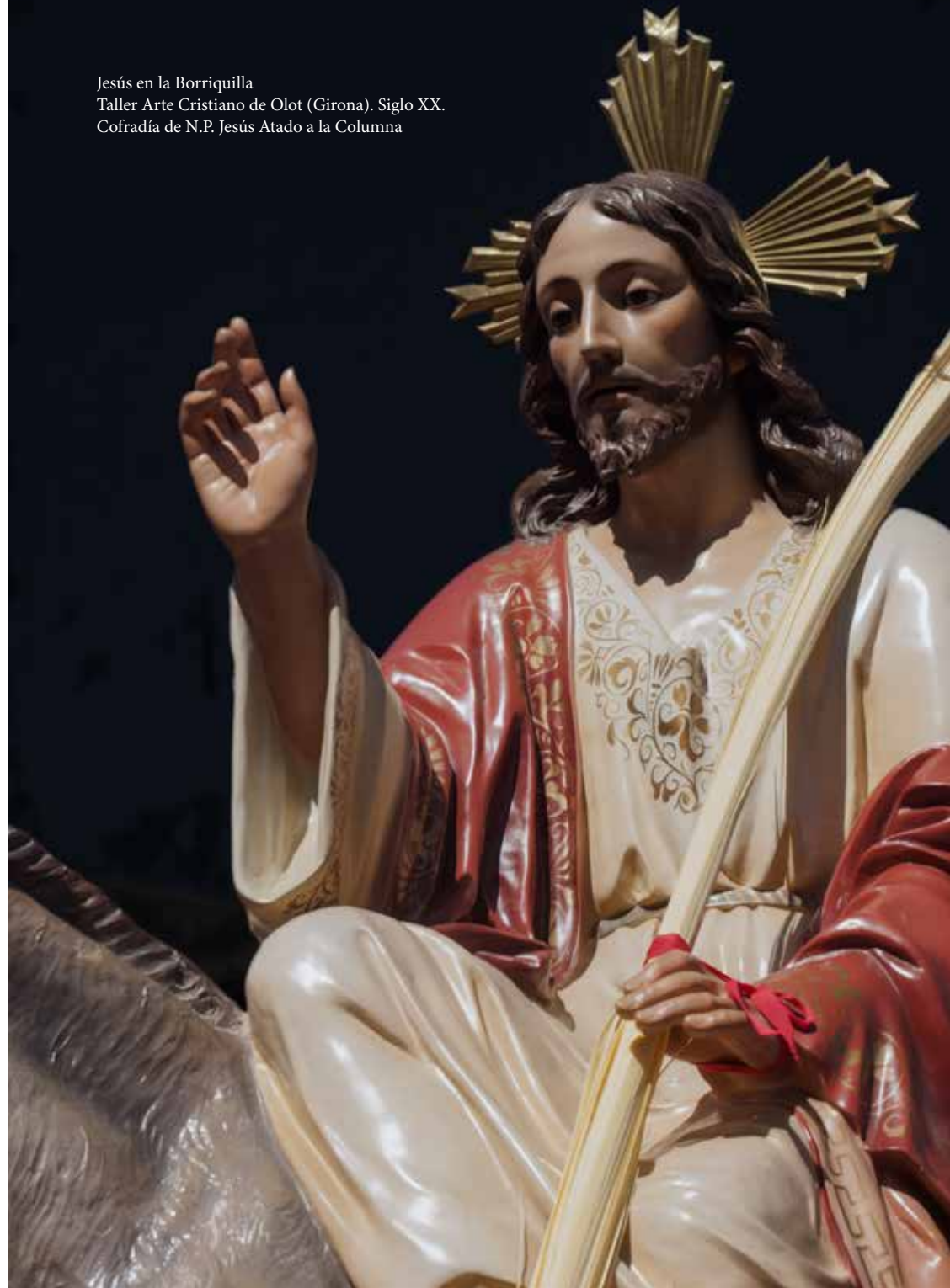
Jesús en la Borriquilla Taller Arte Cristiano de Olot (Girona). Siglo XX. Cofradía de N.P. Jesús Atado a la Columna

Recorrido: Plaza Leciniana, Manuel Salvador Carmona, Camino del Río y Plaza Rodríguez Chico. "Bendición de Ramos": Regreso a la Iglesia por: Cubo de las Monjas, Camino del Río, Manuel Salvador Carmona y Plaza Leciniana. Seguidamente Iglesia de los Santos Juanes Eucaristía.