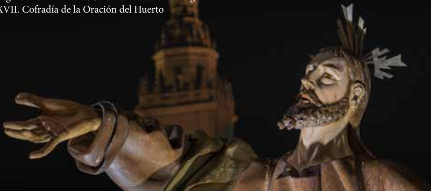
Jesús (Oración del Huerto) Seguidor de Andrés de Solanes. 2º cuarto del siglo XVII. Cofradía de la Oración del Huerto

Pasacalle a las 18:15h. Desde Manuel Salvador Carmona (en caso de condiciones meteorológicas adversas se celebraría en la Iglesia de los Santos Juanes).