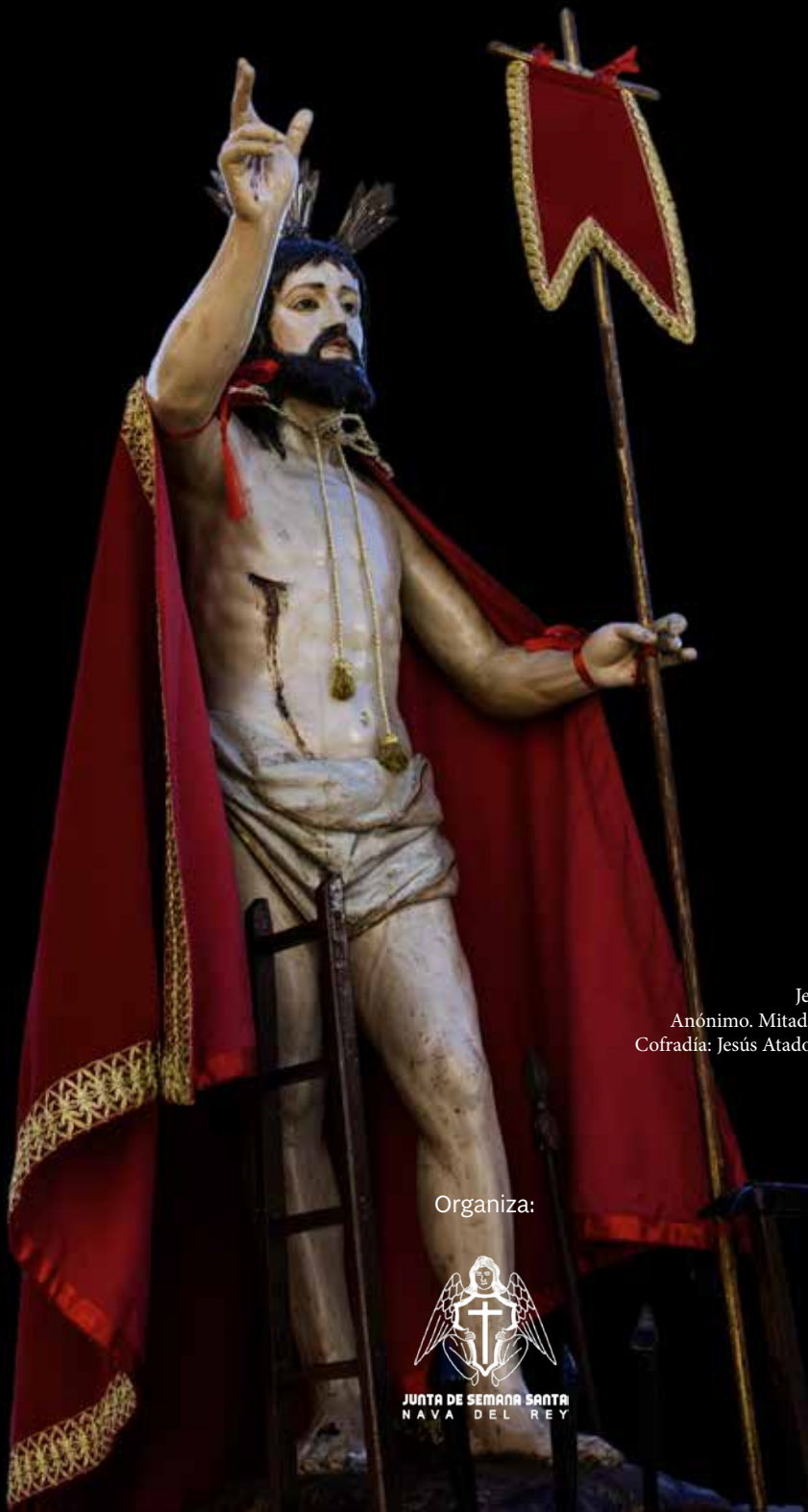
Jesús Resucitado Anónimo. Mitad del siglo XVII. Cofradía: Jesús Atado a la Columna.