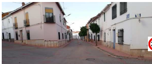
C/JUAN DE BORBÓN- C/CRISTO