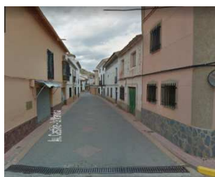
AVDA. DE LOS MÁRTIRES

En nuestra población la velocidad máxima genérica quedará establecida en 30 km/h en todas las calles y 50 km/h en travesías (por ahora) , excepto en las calles del centro de población que se encuentran adoquinadas (consideradas plataforma única acera y calzada), quedando establecida la velocidad máxima de 20km/h para estas calles