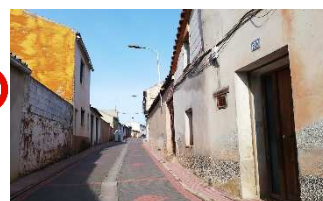
C/ S. JOSÉ