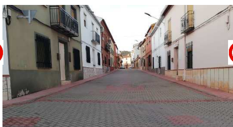
C/CRISTO – JUAN DE BORBÓN