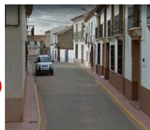
C/J. DE BORBÓN-PLAZA 5º CENTENARIO