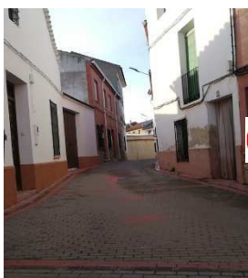
C/CRISTO - C/REINA SOFÍA