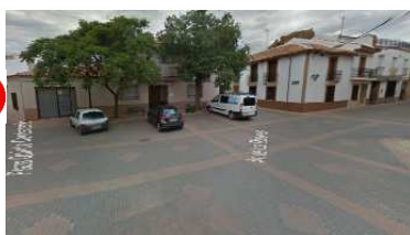
PLAZA QUINTO CENTENARIO