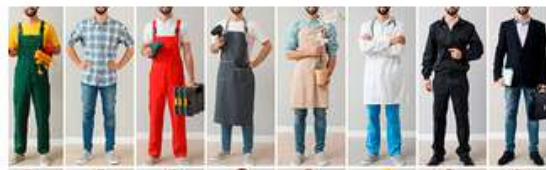
Asesoría de orientación laboral para jóvenes