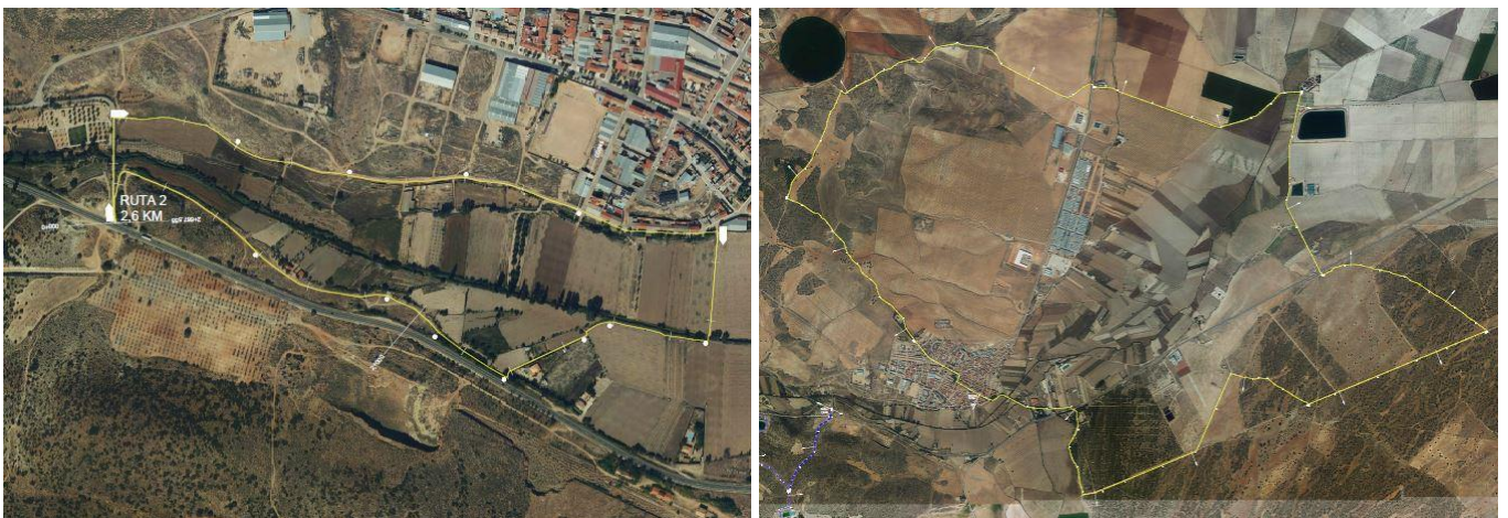
Dos de las seis rutas que están incluidas en los trípticos.

Desde el Equipo de Gobierno hemos planificado una serie de rutas de senderismo por el término municipal de Balazote. Hemos plasmado esta idea en 6 rutas incluidas en dos trípticos que os acompañamos adjuntos con este Boletín Informativo. Apostamos por el deporte y por disfrutar del entorno que nos ofrece Balazote. Os animamos a todos y a todas a pasear por estos rincones tan especiales que hemos preparado.