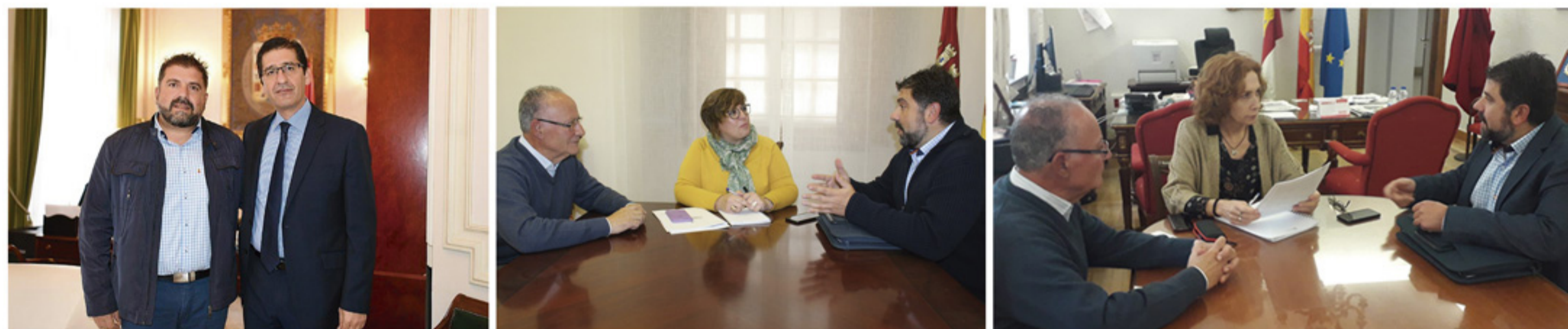
DISTINTAS REUNIONES MANTENIDAS EN LA DIPUTACIÓN PROVINCIAL, EN LA DELEGACIÓN DEL GOBIERNO DE CASTILLA-LA MANCHA Y EN LA SUBDELEGACIÓN DEL GOBIERNO DEL ESPAÑA.

De momento en 2019, por parte de la JCCM y la Diputación, Puebla del Príncipe ha recibido una inversión de más de 670.000 euros, destinados a sufragar los planes de empleo y de obras, el transporte escolar y las ayudas de libros de nuestros estudiantes, las ayudas para nuestros agricultores, y también el ingreso mínimo o la emergencia social de quienes peor lo están pasando. Gracias a esta ayuda, mantenemos la ayuda a domicilio y la vivienda de mayores, y podemos poner en marcha proyectos como la terapia ocupacional y fisioterapia para nuestros dependientes.