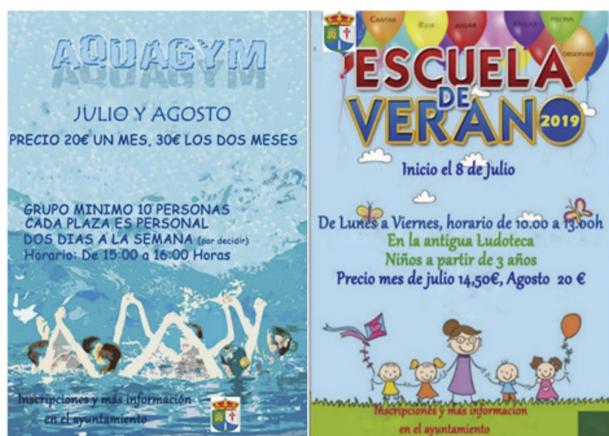
CARTELES INFORMATIVOS DEL AQUAGYM Y DE LA ESCUELA DE VERANO

Vivimos en un pueblo pequeño, con mayor calidad de vida para que nuestros niños y jóvenes tengan alicientes para quedarse a vivir aquí y disfrutar de actividades a la altura de municipios más grandes. Así, el verano y el otoño fueron entretenidos: