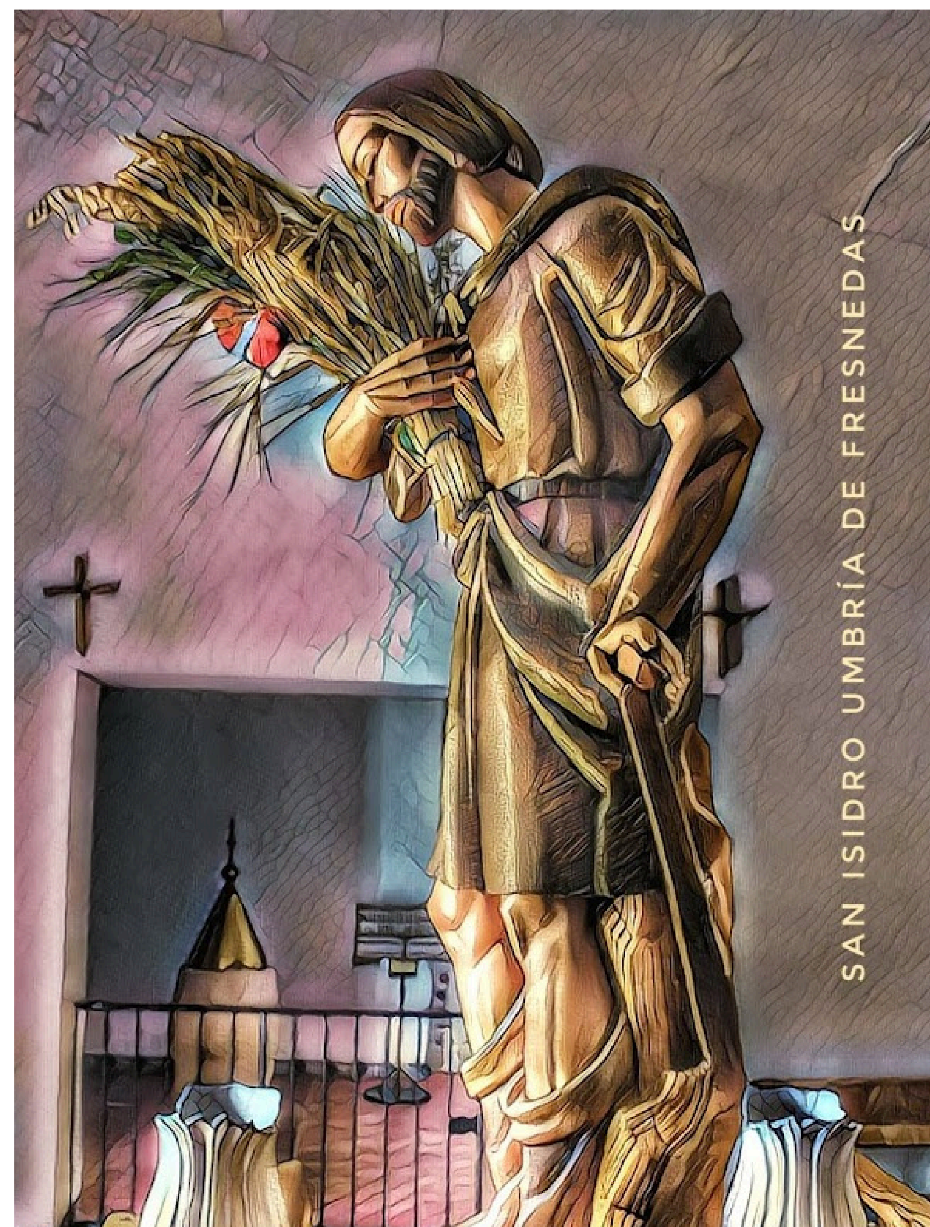
SAN ISIDRO UMBRÍA DE FRESNEDAS