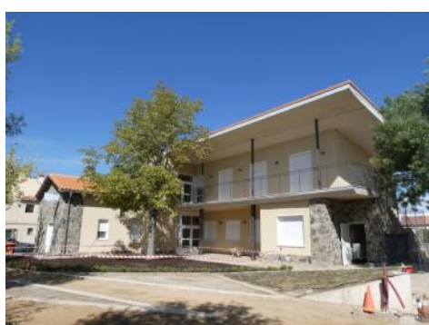
Se trasladaron todas las consultas médicas y de enfermería del municipio al nuevo consultorio médico