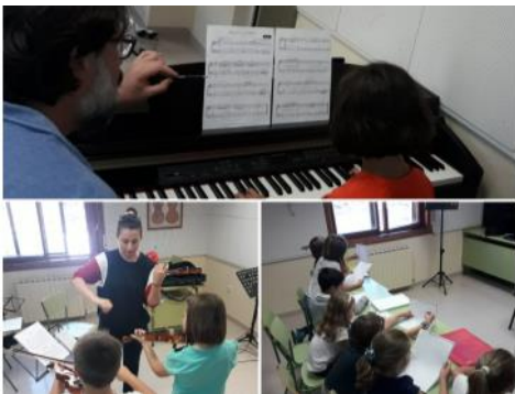
La Escuela Municipal de música y danza con el método “Musica-Educa®” retomó sus clases de música. Aún puedes. Ver página 11