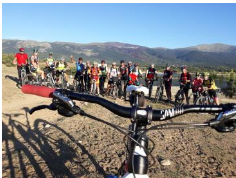
Tuvo lugar la segunda “Kedada” MTB de San Cristóbal de Segovia