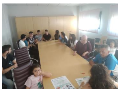
Sus majestades, damas y acompañantes preparando algunos detalles de las fiestas de octubre junto a responsables municipales