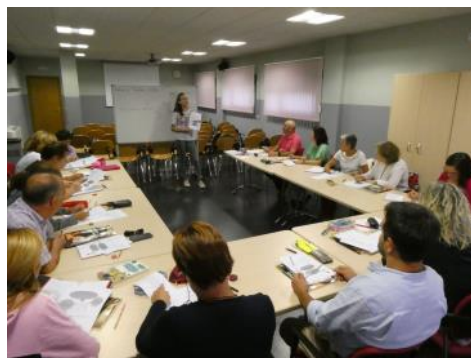
Se inició el curso de inglés para adultos impartido por el CEPA de San Ildefonso. Aún plazas en turno de tarde. Ver pag. 3