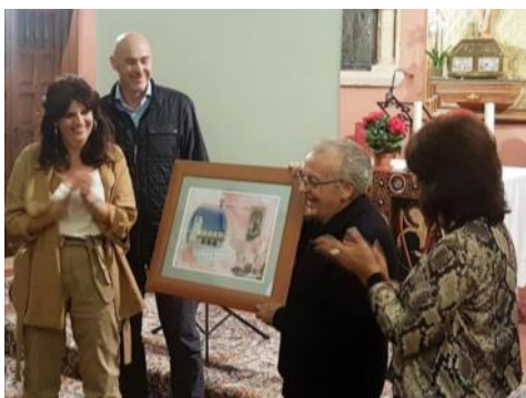
Se despidió con una entrañable celebración a nuestros curas de la parroquia durante tantos años