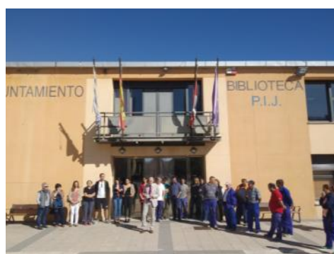
Se guardó un minuto de silencio con motivo de las causas para evitar la “España vaciada”