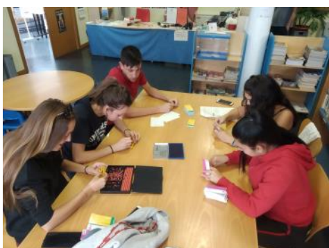
No hay fiesta si no es después de la preparación y el esfuerzo. En la foto, un grupo de peñistas preparando los tickets