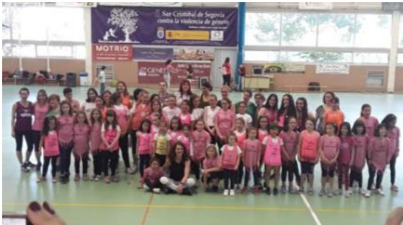
La Escuela Municipal de música y danza ofreció varias jornadas de puertas abiertas de Baile Activo®. Aún puedes. Ver página 11