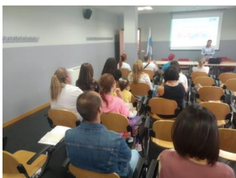
Se iniciaron los cursos de inglés y alemán de la Escuela Municipal de Idiomas de San Cristóbal de Segovia. Aún puedes. Ver pag. 3