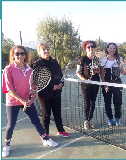
Foto archivo, curso de tenis Abiego 2019-2020.

Juvenil / adultos. Curso de Iniciación al patinaje en línea. 1 día semana / clases de 1 hora.