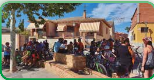
Día de la Bici