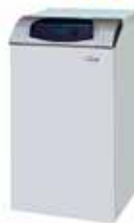
FERROLÍ SILENT D ECO