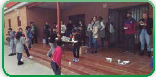
Fiesta del Otoño