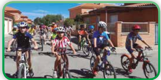
Día de la Bici