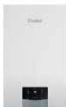
VAILLANT PLUS CS SMART