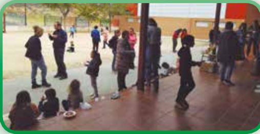
Fiesta del Otoño