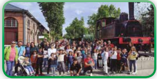
Visita Museo Ferrocarril