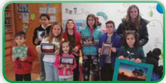
Concurso de Fotografía