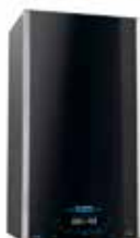
ARISTON ALTEAS ONE NET

Nuevas calderas de gas de condensación. Hasta un 20% de ahorro