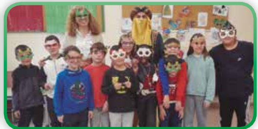
Visita Paje Real