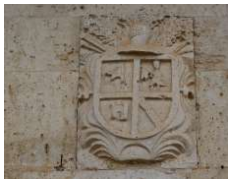
Casa de la familia Olea en la calle Almirante