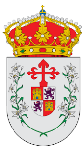
Ayuntamiento de Letur