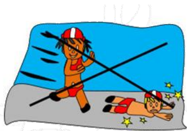
No correr por el borde de la piscina