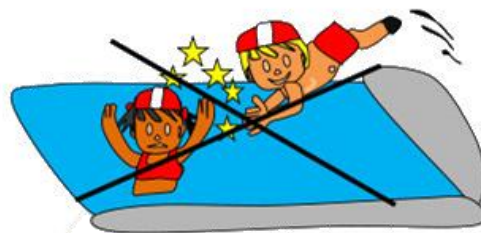
Mirar siempre antes de tirarse al agua