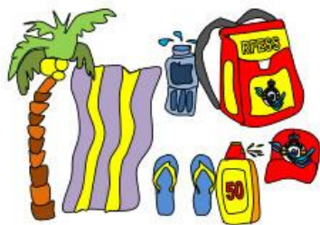
Usar elementos de protección