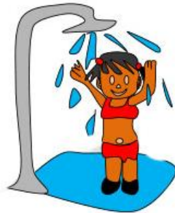
Ducharse antes y después del baño