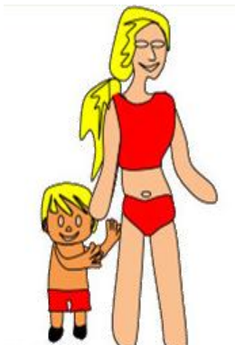
Estar vigilado por una persona adulta