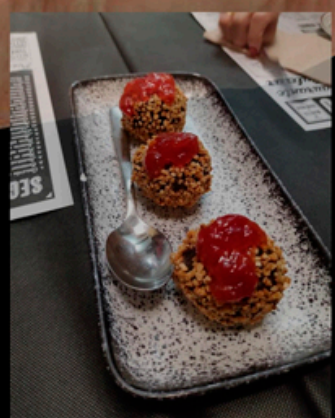
DESCANSO: Trufitas de Morcilla