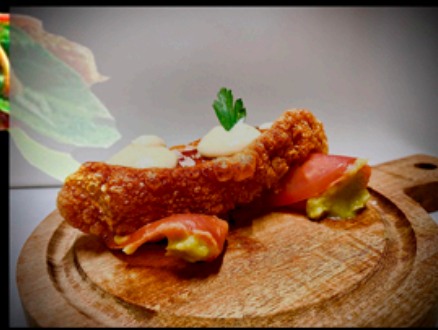
PISCINA: Torrezno de Soria con alioli de cítricos y guacamole de tomate.