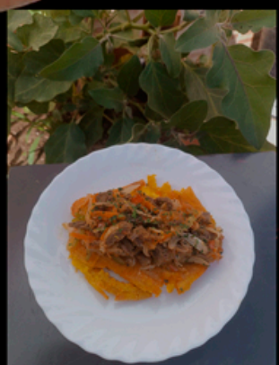
DOLCE VITA: Tachino de Carne