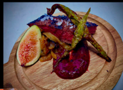
ACROSIS: Entrecot de Ternera Marinada con frutos rojos