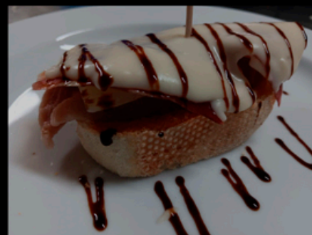
PARAISO: Solomillo Tío Pepe