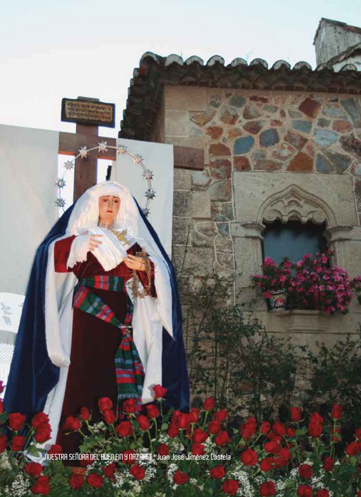
NUESTRA SEÑORA DEL BUEN FIN Y NAZARET. Juan José Jiménez Castela