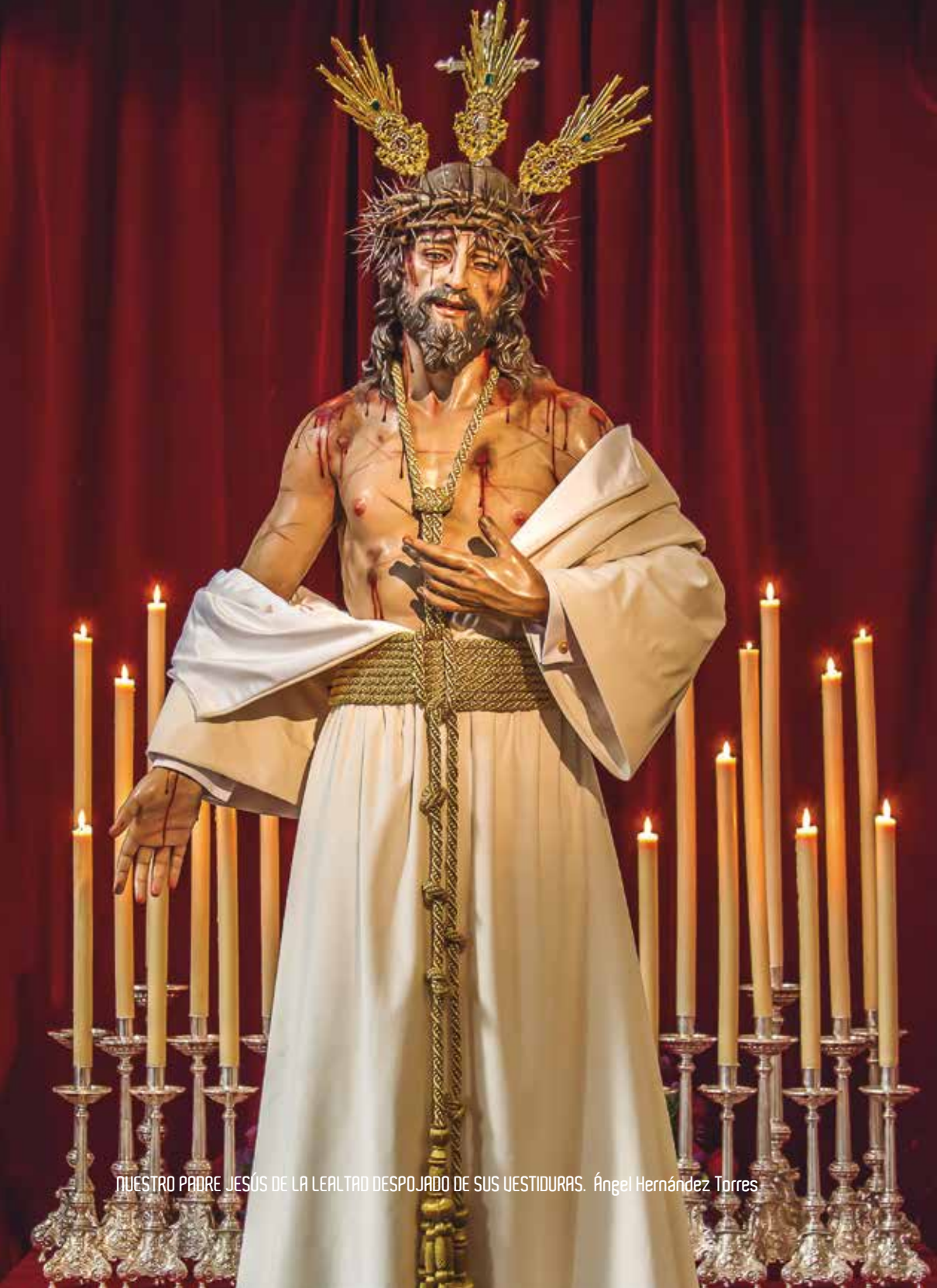
NUESTRO PADRE JESÚS DE LA LEALTAD DESPOJADO DE SUS VESTIDURAS. Ángel Hernández Torres