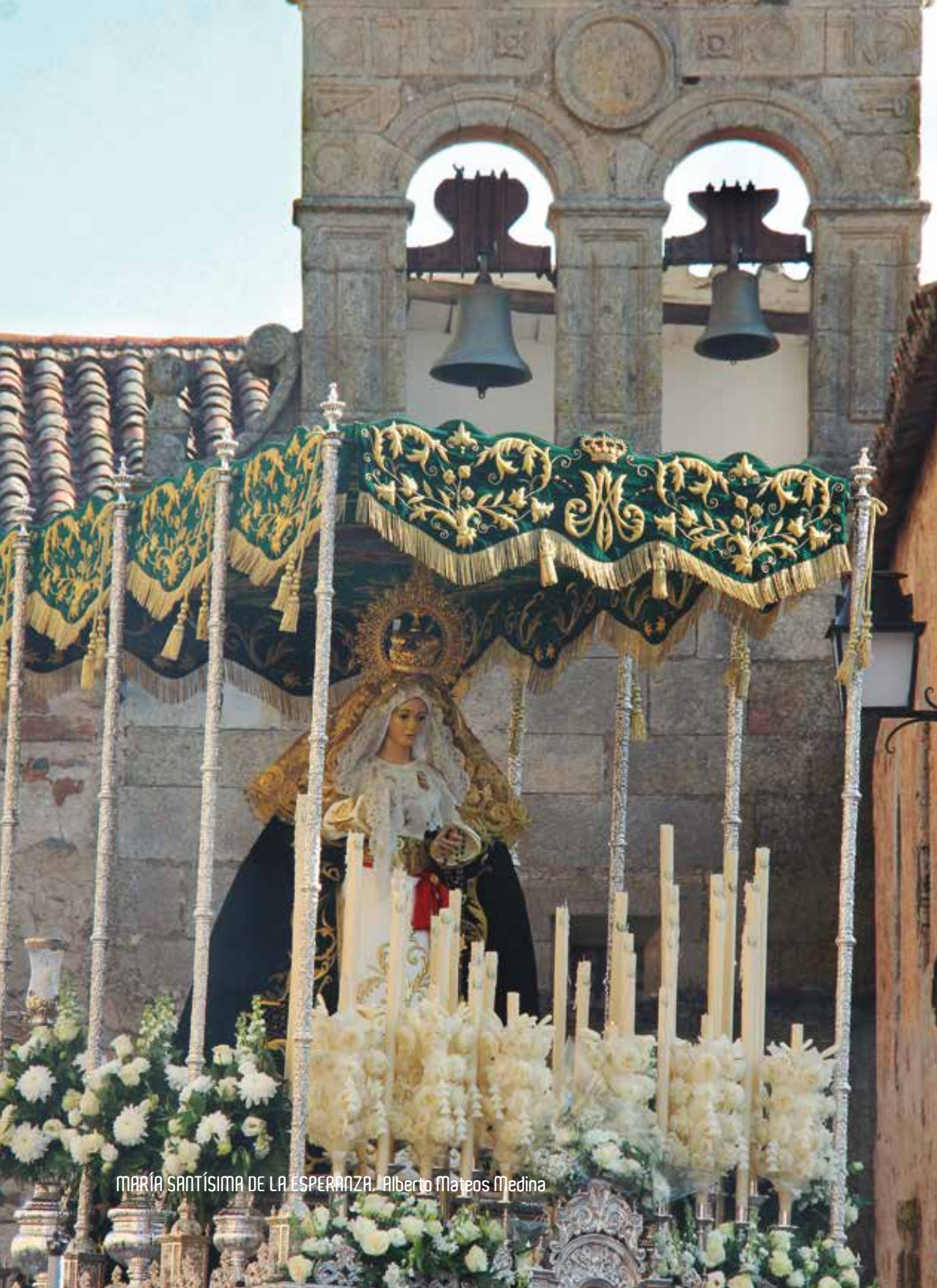
MARÍA SANTÍSIMA DE LA ESPERANZA.