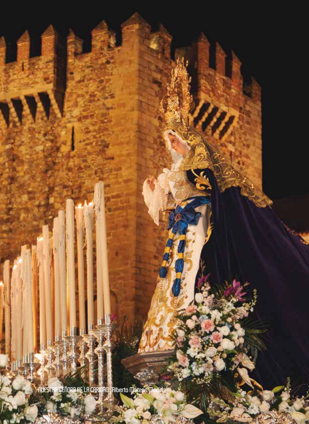
NUESTRA SEÑORA DE LA CARIDAD. Alberto Mateos Medina