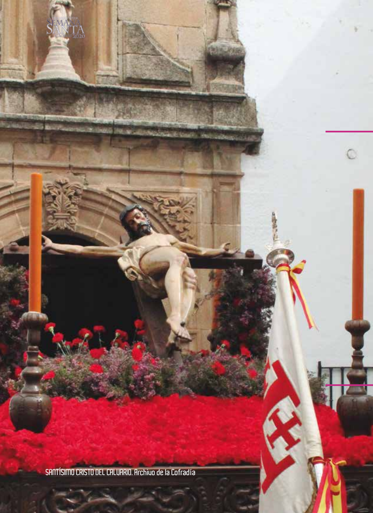
SANTÍSIMO CRISTO DEL CALVARIO.