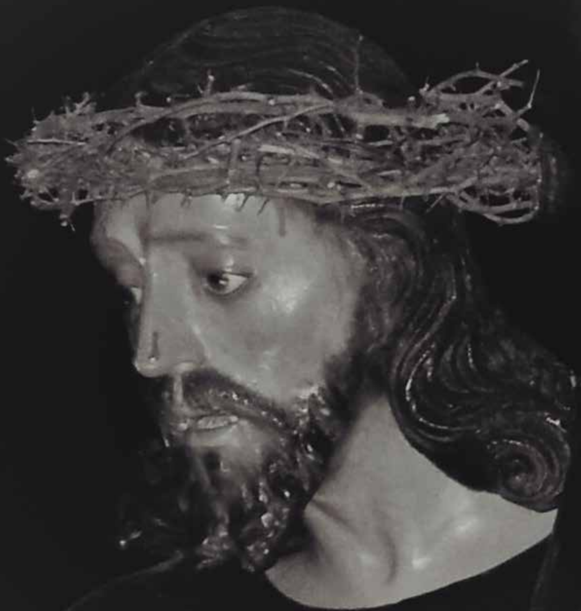
SANTÍSIMO CRISTO NAZARENO DEL AMPARO. Cedida por la Cofradía