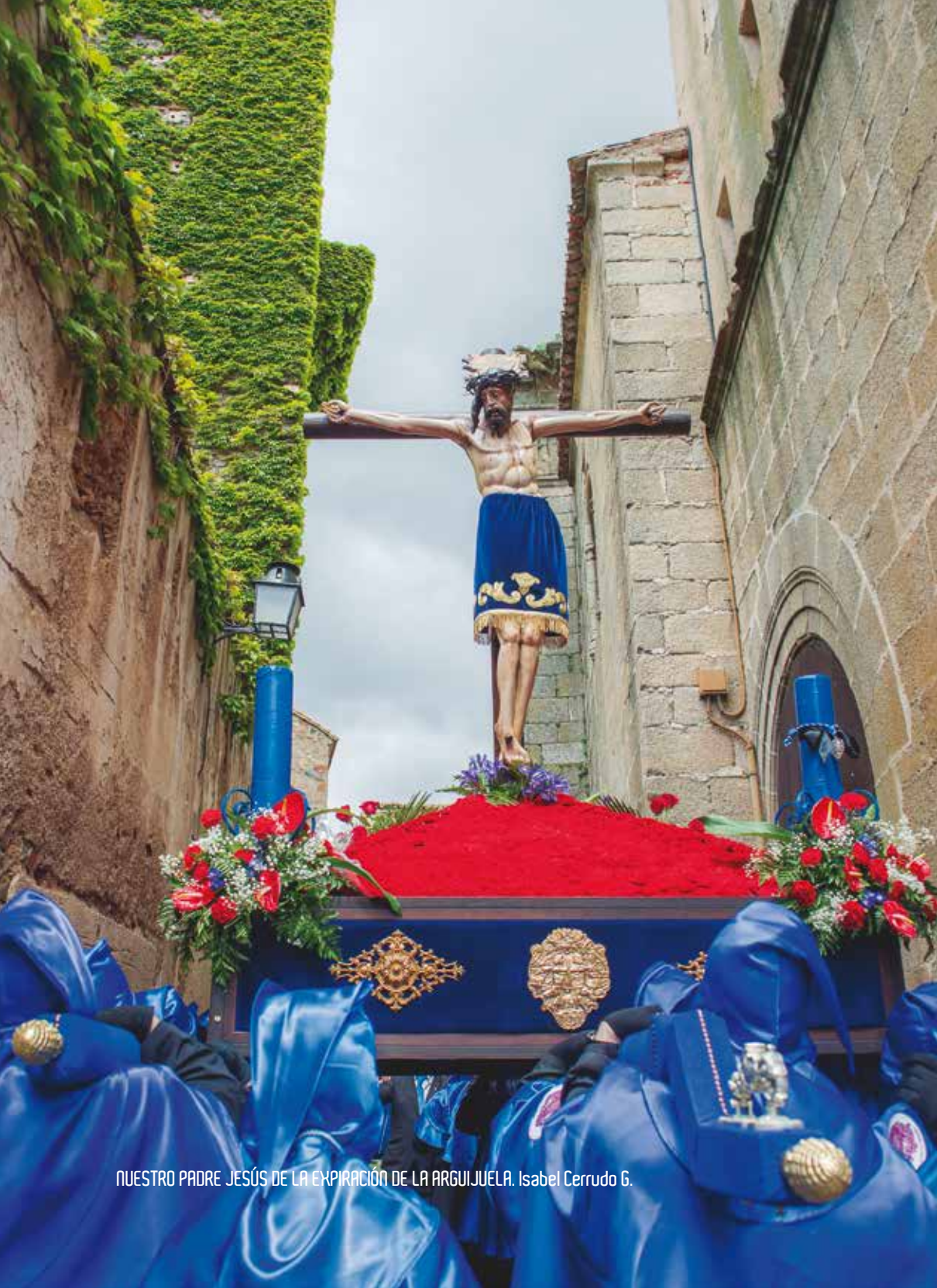
NUESTRO PADRE JESÚS DE LA EXPIRACIÓN DE LA ARGUIJUELA. Isabel Cerrudo G.