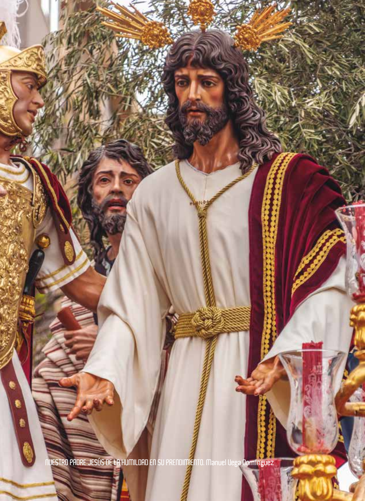
NUESTRO PADRE JESÚS DE LA HUMILDAD EN SU PRENDIMIENTO. Manuel Uega Domínguez