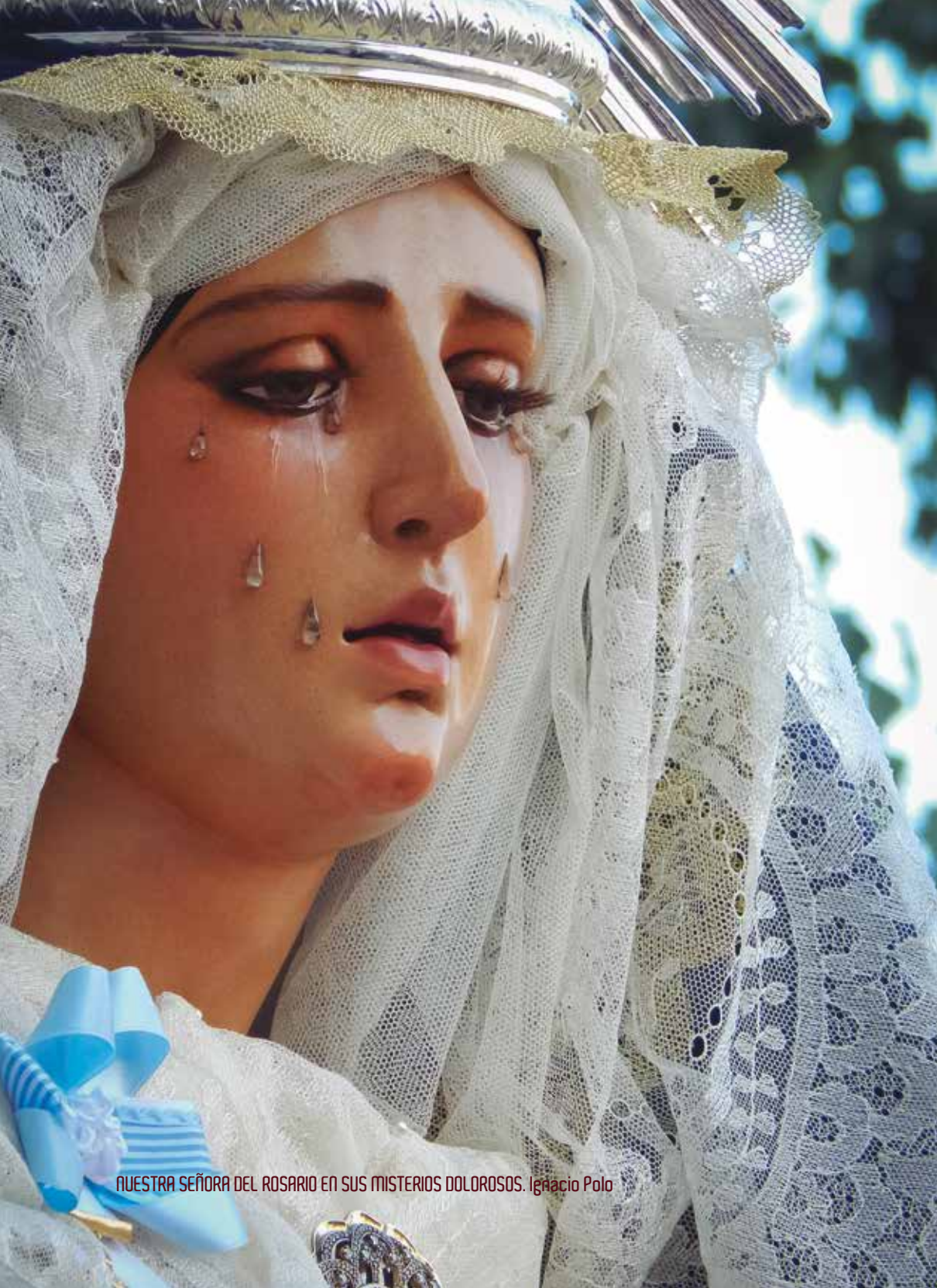
NUESTRA SEÑORA DEL ROSARIO EN SUS MISTERIOS DOLOROSOS. Ignacio Polo