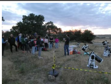
Las nubes impidieron la observación de estrellas en un taller en el que sin embargo aprendimos mucho de astronomía