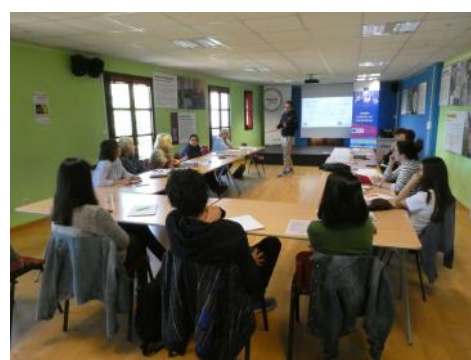
El Ayuntamiento participó en un encuentro de puntos de información juvenil para ampliar y mejorar sus servicios