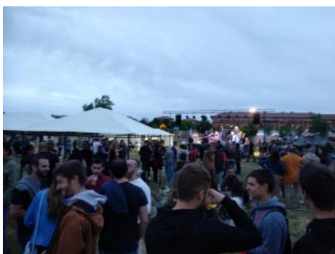
Se celebró la IV feria de la cerveza artesana con éxito de público, en Pradovalle