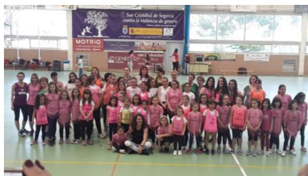
La escuela Municipal de Música y Danza realizó sus festivales finales de curso (foto: grupo de BaileActivo®)