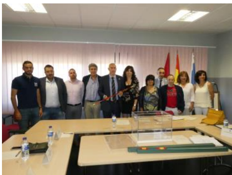
Se constituyó la nueva corporación municipal. Por delante cuatro años para seguir trabajando por los vecinos