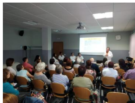
La escuela de salud convocó en su última charla al equipo de cuidados paliativos de Segovia