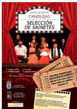
El Ayuntamiento y el grupo de teatro Candilejas, mostraron su solidaridad donando los ingresos de la obra a la asociación de esclerosis