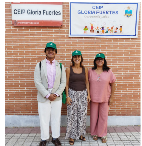
El San Sebastián y el Gloria Fuertes junto con el IES Gaspar Sanz han decidido sumarse a la iniciativa de Cascos Verdes