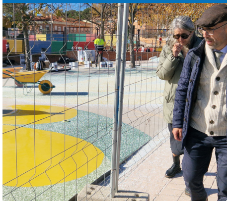
El alcalde supervisa los trabajos de pavimentación en la renovada calle de la Luna

atractiva y cómoda. Y es que las obras de transformación llevadas a cabo en el barrio están a punto de acabar. El resultado, que en algunos puntos ya se ha podido comprobar, es un entorno donde conviven mejor los coches y los peatones y donde la seguridad, la vistosidad y la accesibilidad se han convertido en protagonistas.