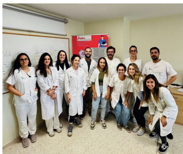
Servicio de Farmacogenética y Medicina Personalizada del Hospital Universitario de Badajoz.

Creo que era ya el momento de volver, volví por estar cerca de mis padres y hermanos.