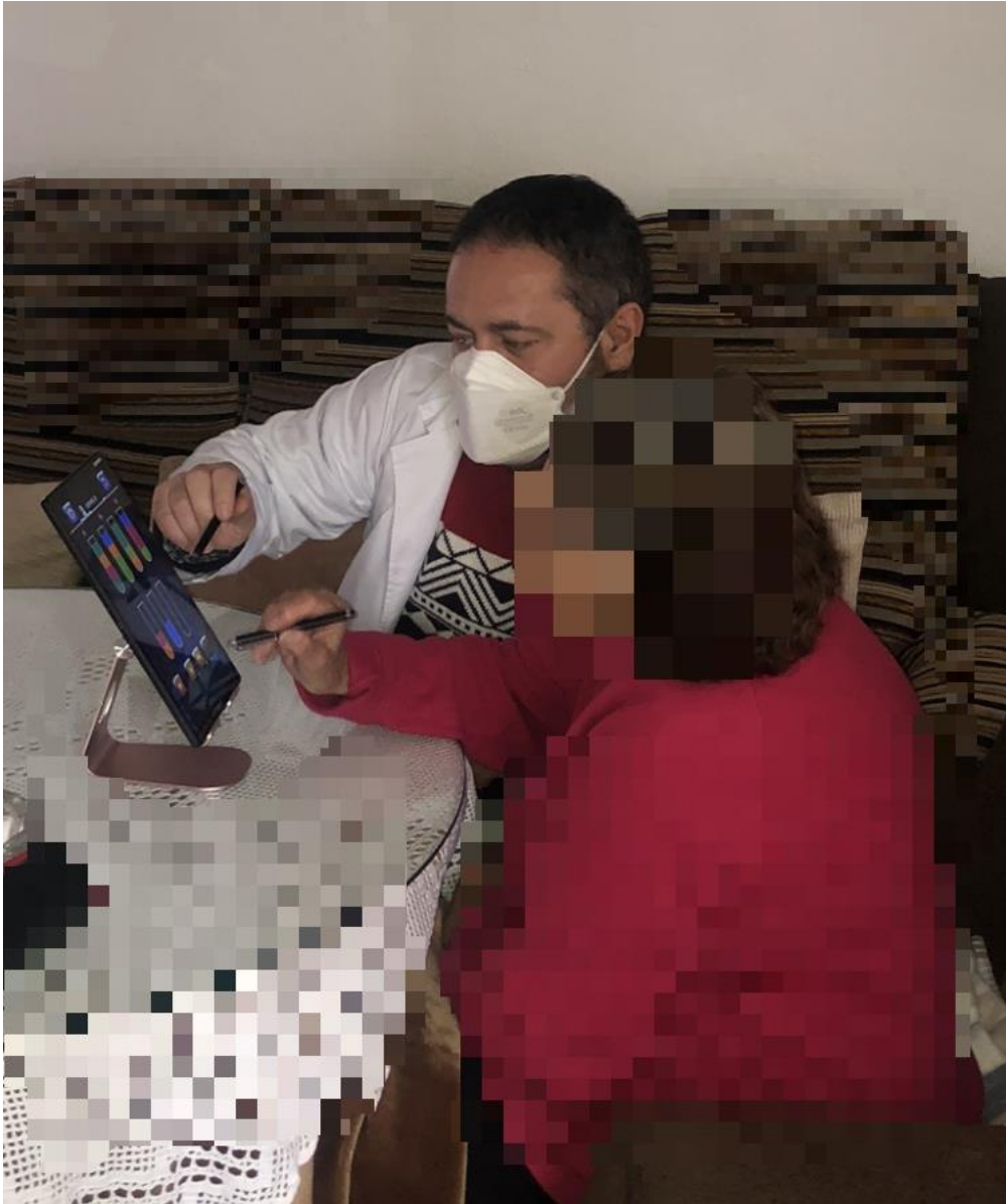
Sesión de Nuevas Tecnologías en domicilio