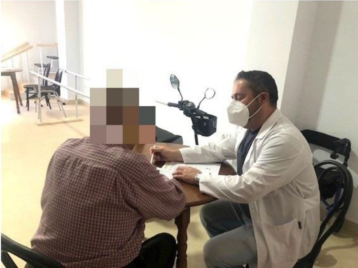
Sesión de evaluación en el Centro Residencial de Berlanga