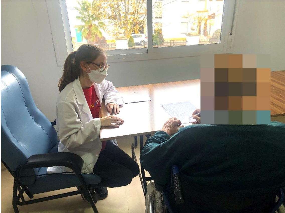
Sesión de evaluación en el Centro Residencial de Berlanga