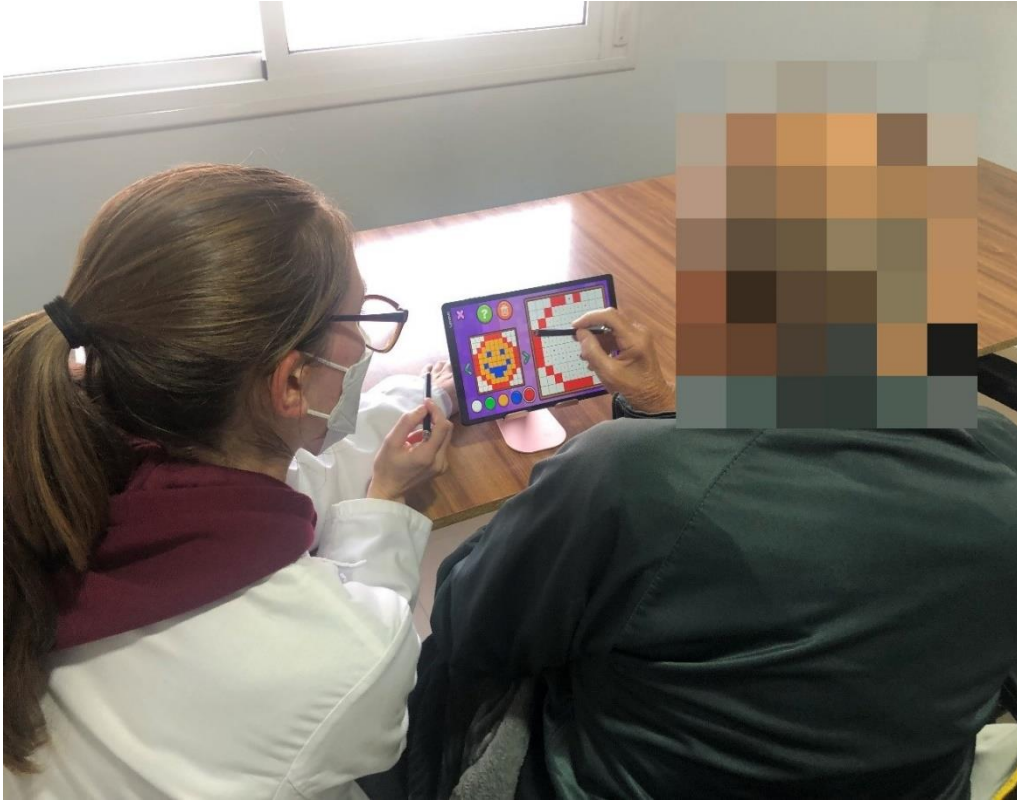
Sesión de Nuevas Tecnologías en Centro Residencial de Berlanga