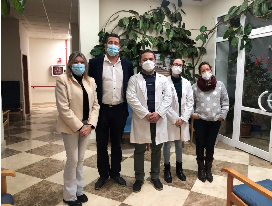
Clausura del proyecto con el equipo profesional, el Alcalde y dos concejalas del ayuntamiento de Berlanga

Con este nuevo proyecto, Berlanga sigue manteniéndose como una de las principales localidades de Extremadura donde se ofrece atención profesional a personas con deterioro cognitivo. Todo para intentar ofrecer una mayor calidad de vida a estas personas y a sus familiares.