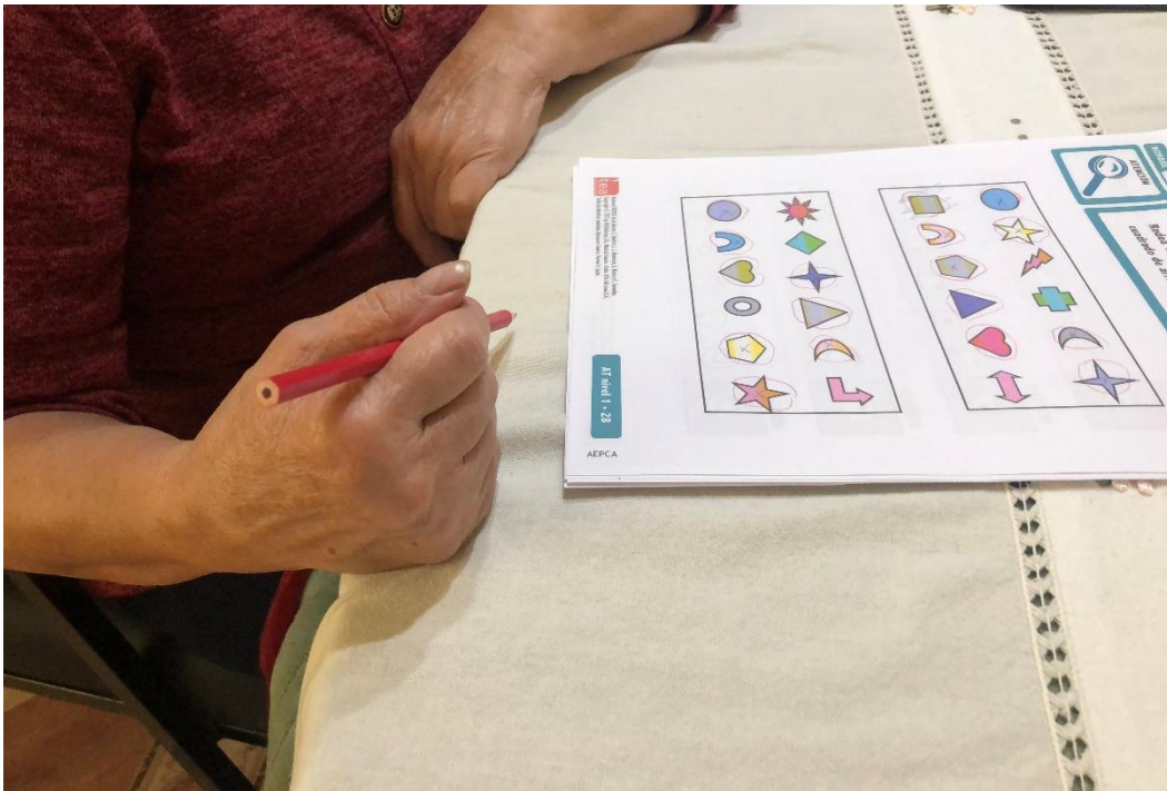
Sesión de Programa Córtex