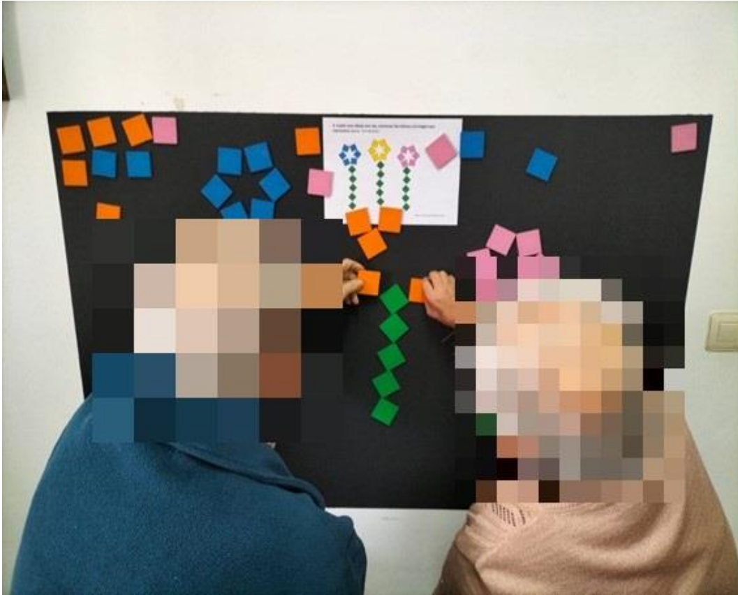
Sesión de Terapia Pixel en Pisos Tutelados de Ahillones