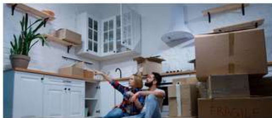
Asesoría de vivienda para jóvenes