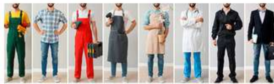
Asesoría de orientación laboral para jóvenes