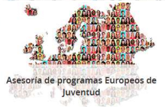
Asesoría de programas Europeos de Juventud