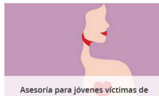
Asesoría para jóvenes víctimas de delitos sexuales

EL INSTITUTO ARAGONÉS DE LA JUVENTUD OFRECE A LA JUVENTUD ARAGONESA UN COMPLETO SERVICIO DE ASESORÍAS GRATUITAS.