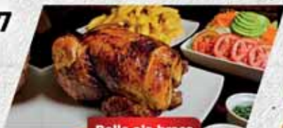
Pollo ala brasa