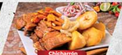
Chicharrón de cerdo